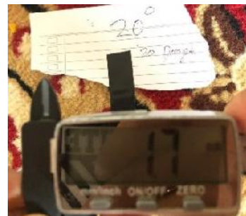
Gambar 5. Pengukuran Diameter Filamen