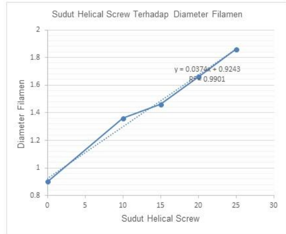
Gambar 6. Pengaruh Sudut Helical Screw terhadap Diameter Filamen