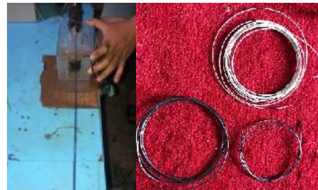
Gambar 4. Pembuatan Filamen dan hasilnya

Mesin yang digunakan pada proses pembuatan filamen printer 3 dimensi adalah mesin ekstrusi single screw . Terdapat 5 variasi sudut yang berbeda, yaitu 0°, 10°, 15°, 20°, dan 25°. Parameter mesin yang digunakan adalah: kecepatan motor penarik 16 rpm, kecepatan ekstrusi 28 rpm, dan suhu 180°C. Pada proses pembentukan filamen, cetakan yang digunakan berbentuk lingkaran berdiameter 2 mm.