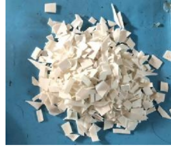
Gambar 3. Plastik HDPE