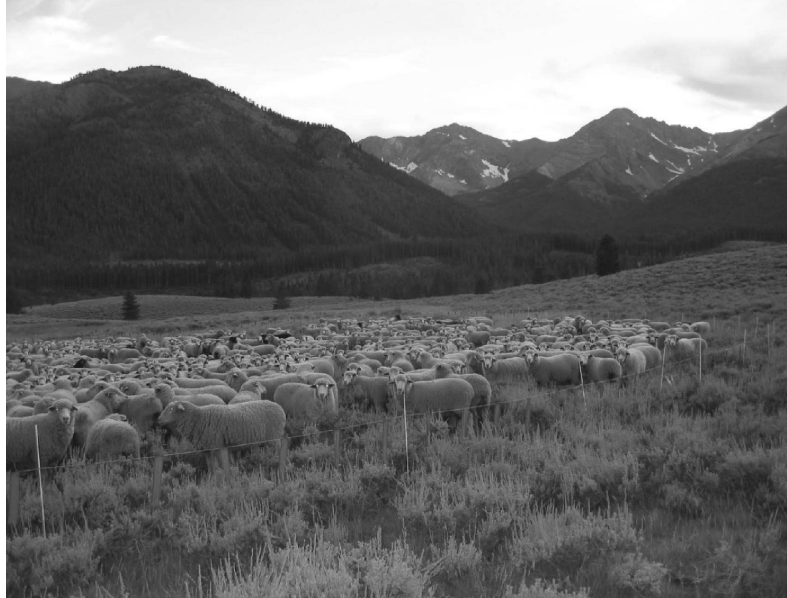
Fig. 3. Centre-sud de l'Idaho : usage de barrières électrifiées, de drapeaux et de la télémétrie pour dissuader les attaques de loups.

En raison surtout de saisons de chasse au canidé, la population de loups gris en Idaho est passée de 870 en 2009 à un peu plus de 600 au printemps 2013. Une tendance similaire se dessine au Montana depuis 2009 et au Wyoming depuis 2012. Quelques meutes en provenance de l'Idaho, protégées car peu nombreuses, se sont récemment établies dans les États voisins d'Oregon et de Washington.