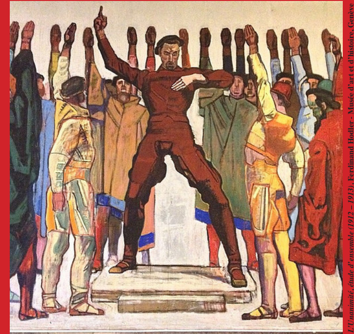
L'Unité, étude d'ensemble (1912 - 1913), Ferdinand Hodler - Musée d'art et d'histoire, Genève