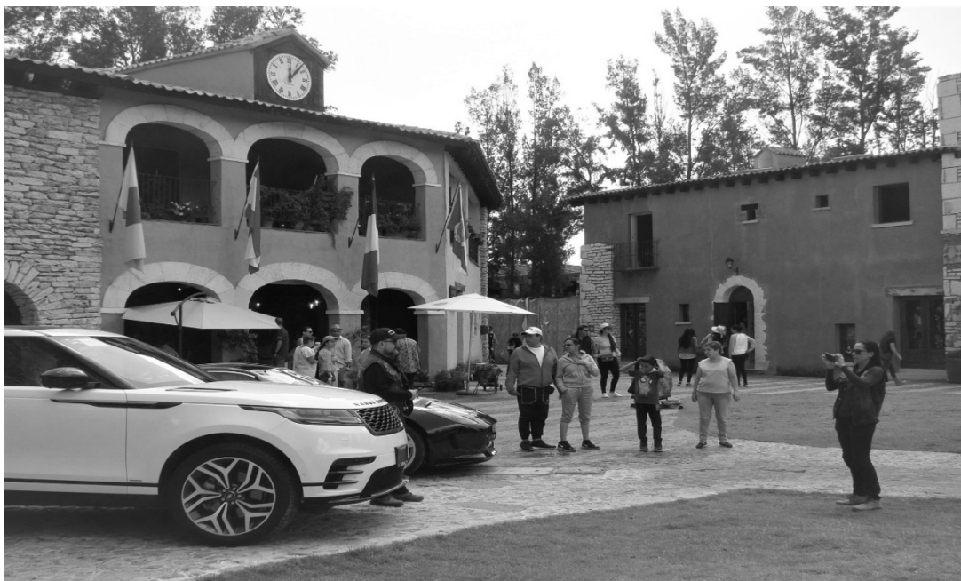
Figura 3. Turistas fotografiándose frente al stand de automóviles Land-Rover y Jaguar. Al fondo, un restaurante con forma de ayuntamiento y una tienda de artesanías, ambas con estilo medieval europeo.

autocatalogados como de auténtica comida española, francesa, italiana, mexicana, mongola, asiática y sudafricana. Dicho de otra manera, un vecino de VQ tiene la tienda más cercana donde comprar fruta a 15 minutos en vehículo particular; sin embargo, enfrente de la puerta de su vivienda puede degustar elementos gastronómicos exóticos , como carne de cocodrilo sudafricano, vino francés, helado natural artesanal de guayaba o chocolate vegano.