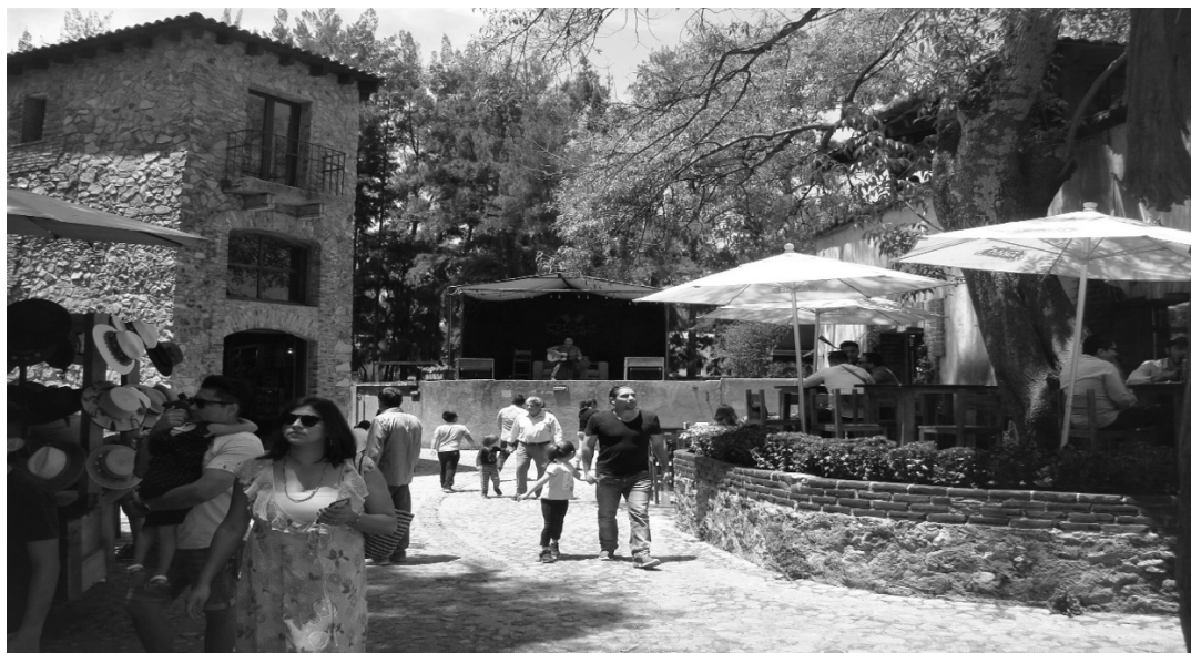
Figura 2. Detalles de un domingo en un rincón de VQ. A izquierda, puesto callejero de sombreros; a la derecha, terraza de restaurante; en el fondo, solista con guitarra ameniza a los viandantes.

Desde el punto de vista de la movilidad, el tamaño del Centro de VQ (30 hectáreas aproximadamente) permite que los desplazamientos internos se realicen principalmente a pie. Esto es, una vez que los usuarios estacionan sus vehículos a motor (automóviles, motocicletas –de alta y baja cilindrada– y autobuses) en los correspondientes parkings, pasear por las calles del pueblo y hacerse fotografías en las puertas de las viviendas y establecimientos es uno de los mayores atractivos turísticos. Ahora bien, existe la posibilidad de rentar durante un tiempo estipulado ponys y/o bicicletas. En el caso de esto último, el cicloturista tiene varias opciones de circuitos y precios tanto dentro como fuera de los límites del complejo. En el caso de estos últimos, las continuas marcas con pintura y carteles de madera que el cicloturista va encontrando durante el trayecto, invitan a reflexionar sobre el interés por parte de la empresa de representar unos límites simbólicos más allá de los establecidos por las operaciones de compra-venta ya consumadas; representaciones dirigidas a los habitantes de las comunidades vecinas y, específicamente, a los ejidatarios y/o propietarios de las tierras con las que colinda VQ.