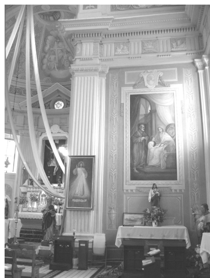
Рис. 9. Лучай, боковой алтарь

Заключение. На территории современной Беларуси явление иллюзионистической архитектуры как таковое возникло в последней четверти XVII века, еще до выхода в свет столь популярного трактата Андреа Поццо. Понимая, в каких условиях это произошло, можно утверждать, что в тот момент финансо-