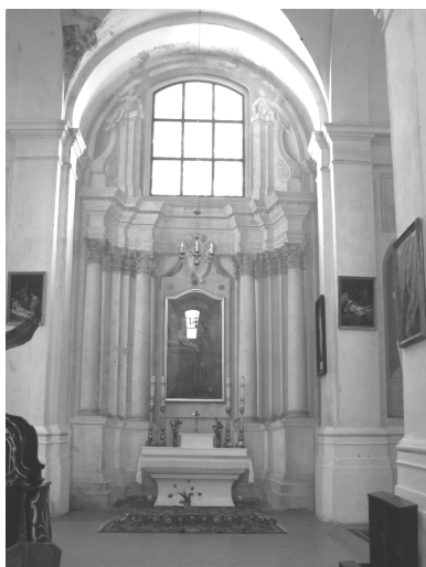
Рис. 6. Бернардинский костел в Будславе, боковой алтарь

ния. И если в Будславе дается иллюзия материальной алтарной наставы как вполне самостоятельного объема, исполненного в камне (рис. 6, 7), то в костеле францисканцев в Гольшанах мастер имитирует еще и несуществующее ближайшее окружение: а именно купол и карниз.