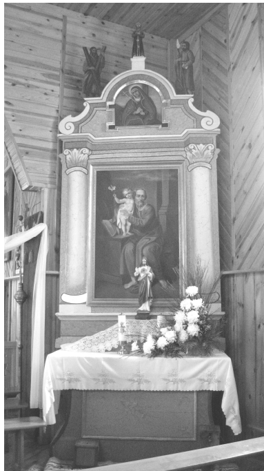
Рис. 1. Трокели, боковой алтарь

Традиционно принято связывать иллюзионистическую живопись на землях ВКЛ с концом XVIII века. Причиной возникновения этого явления выдвигается гипотеза о нехватке денежных средств после первого раздела Речи Посполитой в 1772 году. Однако первые образцы использования эфемерной архитектуры можно найти уже в конце XVII века. После войны 1654–1667 годов между Речью Посполитой и Московской Русью, а также присоединившейся к военным действиям Швецией на территории Великого Княжества Литовского было сожжено и разрушено большинство деревянных и каменных храмов, а также их интерьеров. В тот момент материальные трудности заставили украшать заалтарное пространство самым простым способом – изображение алтарной наставы посредством рисования ее на досках или полотне.