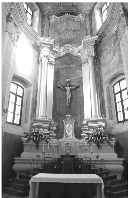
Рис. 2. Кармелитский костел в Могилеве, главный алтарь (современное состояние)

После первого раздела Речи Посполитой могилевский костел кармелитов был назначен указом царицы Екатерины II на функцию архикатедры столицы апостольской 16 мая 1784 года [20, с. 2]. В 1788 году по желанию Митрополита и Архиепископа могилевского был перестроен главный фасад, а позже были переписаны с новыми сюжетами фрески на сводах. Каменный главный алтарь был поставлен в результате очередного ремонта ориентировочно в 60-х годах XIX века. Тогда же художник Fiest переписал фрески в костеле (рис. 4). Визит, датированный 1888 годом, иллюстрирует нам уже совсем новый интерьер [21, с. 1].