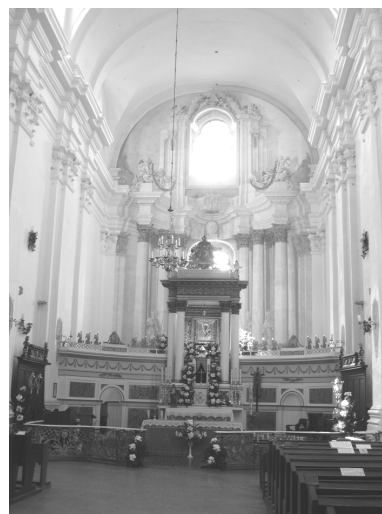
Рис. 7. Бернардинский костел в Будславе, главный алтарь

Главный алтарь костела в Гольшанах нарисован между 1794–1797 годами [9, с. 527]. Фреска выполнена на плоской стене, однако перспективные сокращения и изогнутая вниз траектория карнизов создает впечатление полукруглой апсиды (рис. 8). Художник прорисовал передний и задний план, благодаря чему добился воздушной перспективы и визуально выдвинул вперед объем самой наставы. Каждый раз мастер решает поставленную задачу уникальным способом. Так, в парафиальном костеле в Придруске (постройка 1774 года) главный алтарь написан на полукруглой стене апсиды, и здесь согласно геометрии необходимо было визуальное выпрямить карнизы. За счет такого решения глубина алтарной наставы стала более выразительной. В иезуитском костеле в Лучаях, напротив, вся иллюзионистическая живопись подчиняется законам интерьера, построенного в стиле классицизма. Роспись всего внутреннего объема костела была выполнена после 1783 года [26, с. 91]. Боковые алтари воспринимаются скорее как картины, решенные в общем контексте декоративного оформления стен (рис. 9).