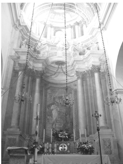
Рис. 8. Гольшаны, главный алтарь

Главный алтарь костела в Гольшанах нарисован между 1794–1797 годами [9, с. 527]. Фреска выполнена на плоской стене, однако перспективные сокращения и изогнутая вниз траектория карнизов создает впечатление полукруглой апсиды (рис. 8). Художник прорисовал передний и задний план, благодаря чему добился воздушной перспективы и визуально выдвинул вперед объем самой наставы. Каждый раз мастер решает поставленную задачу уникальным способом. Так, в парафиальном костеле в Придруске (постройка 1774 года) главный алтарь написан на полукруглой стене апсиды, и здесь согласно геометрии необходимо было визуальное выпрямить карнизы. За счет такого решения глубина алтарной наставы стала более выразительной. В иезуитском костеле в Лучаях, напротив, вся иллюзионистическая живопись подчиняется законам интерьера, построенного в стиле классицизма. Роспись всего внутреннего объема костела была выполнена после 1783 года [26, с. 91]. Боковые алтари воспринимаются скорее как картины, решенные в общем контексте декоративного оформления стен (рис. 9).