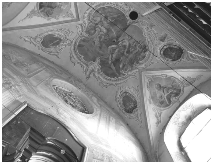
Рис. 5. Вильно, костел св. Ежи ордена кармелитов тревичковых

Подобным образом, как и в костеле кармелитов в Могилеве, выполнена фресковая живопись костела св. Ежи ордена кармелитов тревичковых в Вильно (рис. 5).