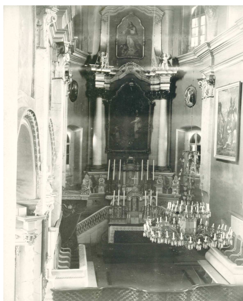
Рис. 4. Кармелитский костел в Могилеве, главный алтарь (фото до 1912 г.)