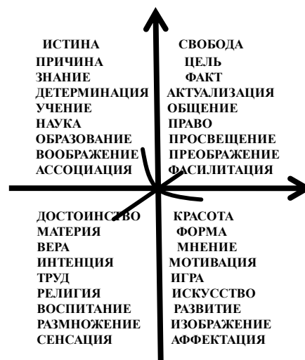
Рис. 1. Фрейм « \Psi -квинтэссенциал»

Универсум конфессиональности педагогического общения позволяет выйти за пределы религиозной частности и профессиональной однозначности при помощи «интерпретационного фрейма повестки дня» (В.А. Янчук, 2000). Психолог, вооруженный «фреймом», преследует устойчивую тенденцию поиска и интерпретации уникальных особенностей и проявлений исследуемого феномена, «верифицируемого типичными объяснительными и каузальными схемами, обстоятельствами, событиями» [6, с. 347]. Для будущих психологов и преподавателей английского языка не прошел незамеченным тот этнолингвистический факт, по которому термин «фрейм» переводится на белорусский язык как «фрама» (англ. frame), оконная рама или «фрамуга». В качестве психологического конфессионала, « фрейм » как Windows, пропускает поток информации, метафорически защищая его, при наличии надёжной «рамы», от «вирусов» стереотипов и деструкций. Эта защита заключается в критическом осмыслении и позитивном не замалчивании любой спорной информации. Такой изысканной форме («форме порядка как хаоса» [4, с. 614]) соответствует только крест (cross). Десакрализованный Р. Декартом, он координирует ризому \Psi в качестве аппликаты (applicata), присоединяющей любое высказывание к диалогической цели дискурса. Квинтэссенциал \Psi – это структурная метафора «Я» из пунктуальной «самости» \Psi (рис. 1).