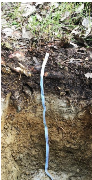
Рис. 4. Подзол иллювиально-железистый (разрез № 1) Fig. 4. Ferric Illuvial Podzol (soil pit No. 1)

О – 0–15 см, лесная подстилка, бурая, рыхлое сложение, опад растений находится на различных стадиях разложения, состоит из опада ели, шишек, сфагнового мха, разнотравья, отмерших веток и листьев кустарничков, горизонт густо пронизан корнями кустарничков, свежий, встречаются копролиты червей, переход в нижележащий горизонт по цвету и по плотности сложения, граница перехода в нижележащий горизонт затечная;