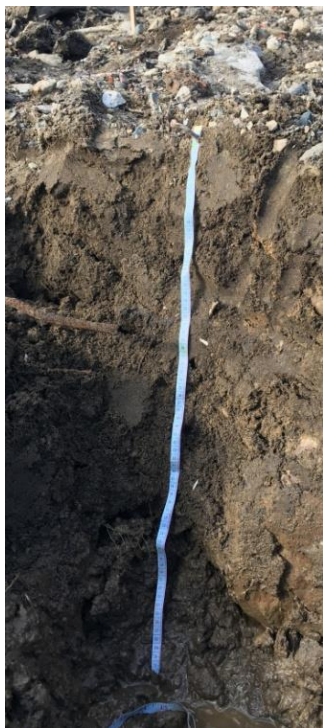
Рис. 5. Органолитострат (разрез № 5)