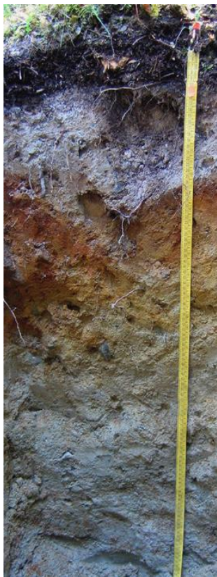
Рис. 3. Подзол иллювиально-железистый. Fig. 3. Ferric Illuvial Podzol.

О – 0–5(11) см, лесная подстилка, бурого цвета, свежая, слоистая, обильно пронизана корнями, сложена остатками хвои, кустарничков, веток, корней, переход в нижележащий горизонт по цвету, граница перехода волнистая.