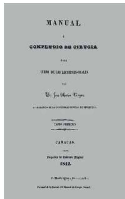
Рисунок 3. Пособие по хирургии Х.М. Варгаса, 1842

Figure 2. Drawing of J.M. Vargas on a fibrous tumor in the left temporo-parietal region. Vargas Complete Works. Vol. III, p. 180. Recompilation by Blas Bruni Celli, 1986