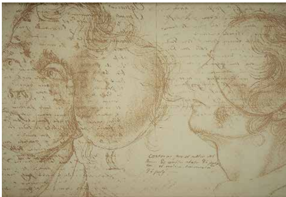
Рисунок 2. Фиброзная опухоль в левой височно-теменной области, рисунок Х.М. Варгаса. Полное собрание сочинений Х.М. Варгаса, т. III, с. 180, составитель Блас Бруни Челли, 1986

Figure 2. Drawing of J.M. Vargas on a fibrous tumor in the left temporo-parietal region. Vargas Complete Works. Vol. III, p. 180. Recompilation by Blas Bruni Celli, 1986