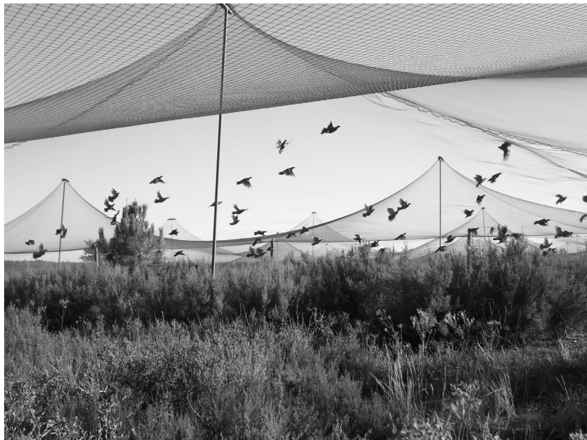
Figura 3. Detalle de un voladero en una granja de perdiz roja. Figure 3. Flight pen in a red-legged partridge farm.