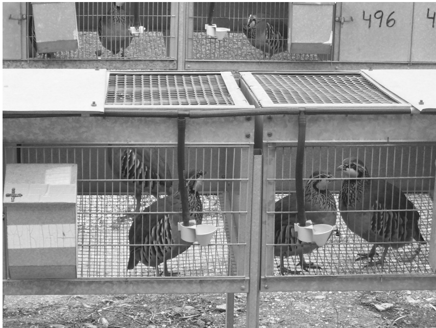
Figura 2. Jaulas de puesta en una granja intensiva de perdiz roja. Figure 2. Red-legged's layer cages in intensive farming.