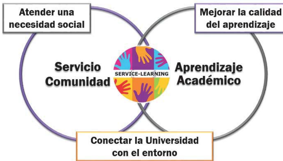
Figura 1. El aprendizaje-servicio combina un servicio a la comunidad con un aprendizaje académico relacionado con el currículum del estudiante. Así, se consigue mejorar la calidad del aprendizaje, atender una necesidad social y conectar la Universidad con el entorno.

lizado ya numerosas experiencias con resultados excelentes, tal y como queda de manifiesto en la Red Universitaria de Aprendizaje Servicio, de la que nuestro grupo forma parte. De hecho, en el año 2015, la Comisión de Sostenibilidad de la CRUE instó a “emplear el Aprendizaje-Servicio como una herramienta poderosa mediante la cual se desarrollan competencias clave para la formación y el futuro desempeño profesional de los estudiantes” y propuso la “institucionalización del Aprendizaje-Servicio en las universidades españolas para impulsar la sostenibilidad curricular, contribuir al desarrollo de una sociedad más justa y mejorar los aprendizajes académicos y sociales que favorecen el desarrollo competencial de los estudiantes”. Estas recomendaciones ya han sido adoptadas por algunas universidades españolas como la Universidad Politécnica de Valencia o la Universidad de Santiago de Compostela entre otras. Esperamos que pronto la Universidad de León pueda figurar entre ellas.