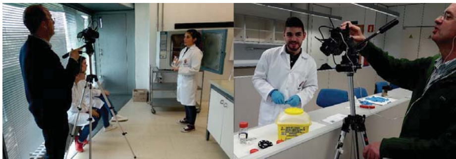
Figura 5. Estudiantes de Grado grabando el vídeo correspondiente a una de las prácticas.

Los buenos resultados obtenidos, nos animaron a continuar en esta línea, por eso, durante el curso 2016-17 desarrollamos el tercer proyecto titulado “La ciencia a tu alcance: prácticas para la enseñanza de Ciencias elaboradas por futuros científicos”. El objetivo de este proyecto fue generar unos materiales docentes que pudieran servir a los profesores de secundaria y bachillerato como herramienta para la enseñanza de las Ciencias. Estos materiales docentes han incluido un manual con los guiones de las prácticas desarrolladas en el proyecto anterior acompañadas de los correspondientes vídeos didácticos. En este proyecto han participado 26 estudiantes de Grado, que elaboraron el guion de la práctica para su inclusión en el manual, prepararon el guion cinematográfico para la grabación del vídeo y finalmente, grabaron el vídeo correspondiente ( Fig. 5 ).