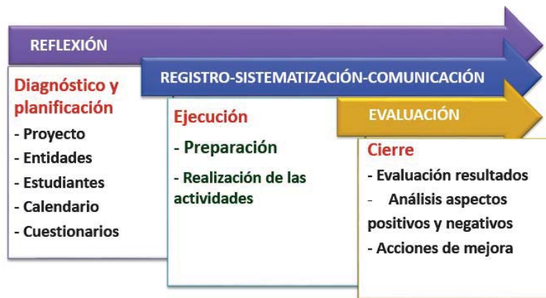
Figura 2. Fases de desarrollo de los proyectos de Aprendizaje-Servicio.

gunda de ejecución y finalmente, una tercera de cierre del proyecto. Además de estas fases secuenciales, a lo largo de todo el proceso hay unas acciones transversales de reflexión, de registro sistematizado de todas las actividades e incidencias y de evaluación de los resultados, que sirven para mejorar actuaciones futuras (Fig. 2).