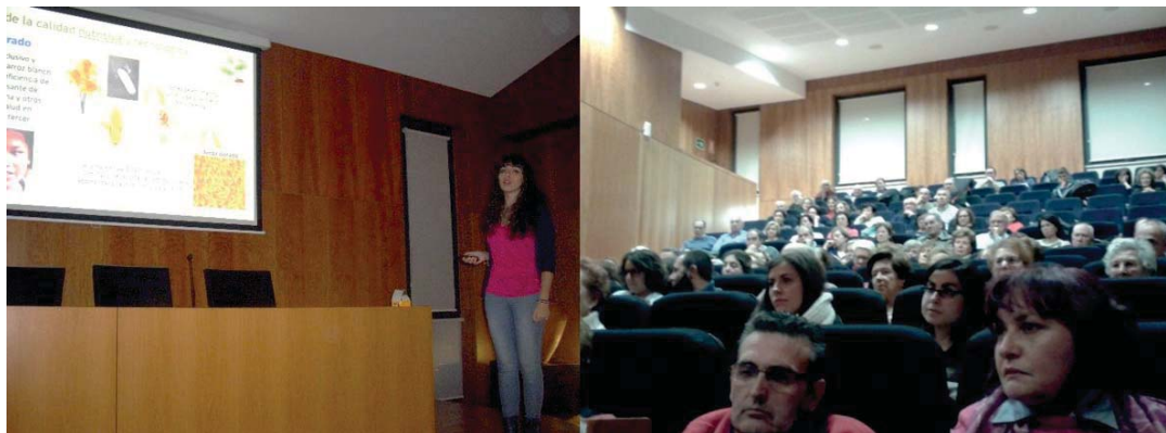
Figura 3. Estudiante de Grado impartiendo una de las charlas divulgativas en la sala de cultura de Bembibre.

de charlas. En este proyecto participaron 20 estudiantes de Grado que, orientados por los profesores, prepararon las charlas y las impartieron en salas de cultura de 10 ayuntamientos de la provincia de León. A las charlas divulgativas asistieron un total de 323 personas de edades comprendidas entre los 45 y los 60 años que valoraron muy positivamente la actividad ( Fig. 3 ).