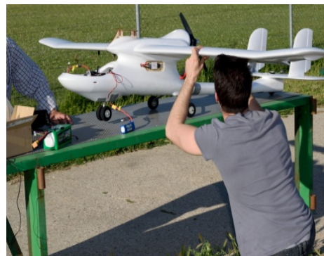
b) Ajustes primer día de vuelo