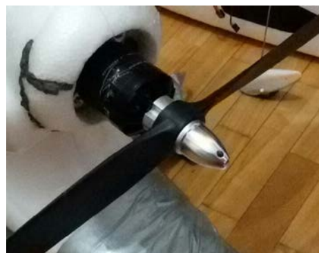
d) Fuselaje reparado