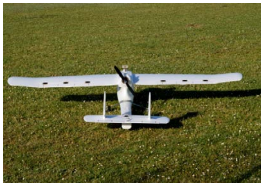
a) Prototipo montado

piloto experto detecta posibles vibraciones en el motor y decide aterrizar. Justo cuando toma tierra, el motor sale disparado cizallando parte del fuselaje. La causa de la salida del motor de su bancada junto con la montura se debe a unas vibraciones en el motor no tenidas en cuenta durante el diseño del fuselaje. Se diseña una superficie de montaje del motor con 3D, se añaden injertos en el fuselaje para repartir mejor las cargas del par del motor y se pega todo con abundante epoxi y Cianoacrilato (Figura 1d).