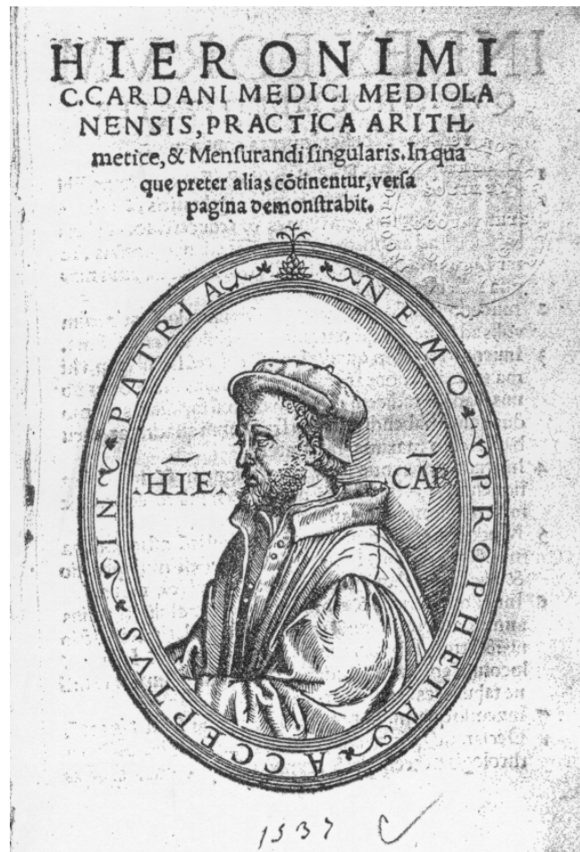
Figura 1: Girolamo Castiglione Cardano, Practica Arithmetice, & Mensurandi singularis (1539)

El tema de los préstamos a corto plazo es uno de los doce aspectos, en concreto el once, de que consta la exposición latina de teneduría de libros -de cuatro páginas de extensión-, recogida en el tratado de Cardano, Practica Arithmetice & Mesurandi singularis (1539), capítulo LX, titulado en el índice "De ratione librorum mercature" y en el texto "De ratione librorum tractandorum" (véase Figura 1):