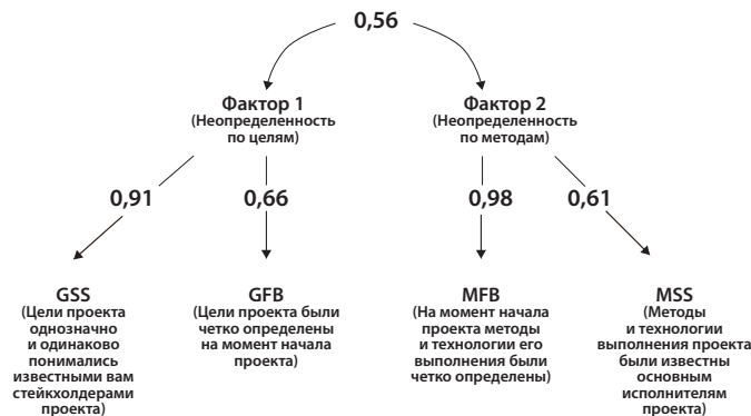
Таблица 6 Результаты факторного анализа индикаторов успеха проекта Table 6 Factor analysis of project success indicators