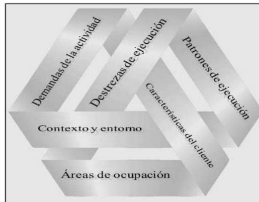
Figura 1. Dominio de la Terapia Ocupacional. Apoyando la salud y la participación en la vida a través del compromiso con la ocupación.

protección a la infancia, las cuales son convertidas en hábitos debido a la repetición de patrones establecidos arbitrariamente por los centros de protección. De igual modo, de los discursos emerge una visión respecto a cómo la institucionalización constituye un espacio donde pueden ocurrir cambios personales, que conducen a cambios sociales en la vida de los sujetos existiendo un vuelco en sus ocupaciones en relación al antes y después del proceso de institucionalización; en ocasiones los resultados muestran como dentro de estas instancias se viven situaciones de privación ocupacional que pueden influir y repercutir en el desempeño ocupacional de las personas.