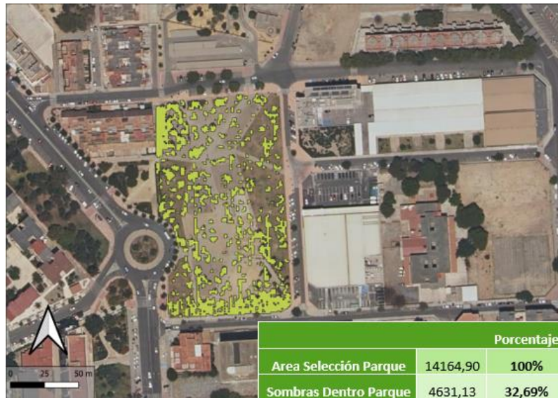
Figura 1. Área total sombreada en el parque desde las 11:00 h hasta las 15:00 h del 10 de junio de 2020 obtenida mediante QGIS.