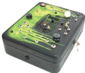
Figura 1 - Instrumentos desenvolvidos para a performance Trashology: 404///+E&lt; ratic8 . Hugo Paquete. 2014

A performance Trashology: 404///+E&lt; ratic8 , constrói-se com o recurso ao conceito de Low-hardware instrumentos e softwares construídos de forma independente serve como exemplo, dos conceitos em contexto. Estes "hyper-hardwares" (Paquete, 2014: 119), instrumentos e softwares Low-Tech desenvolvem-se pela necessidade de conceber um conjunto de instrumentos independentes das imposições meta-políticas e do capital implicadas nos funcionamentos do hardware e software.