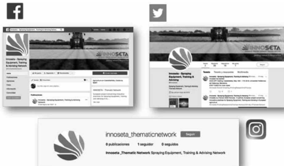
Figura 5. INNOSETA en las redes sociales: Facebook: https://www.facebook.com/innosetaNetwork/ ; Twitter: https://www.twitter.com/innosetaA ; Instagram: https://www.instagram.com/innoseta_thematicnetwork/

Este proyecto está financiado por el Programa de Investigación e Innovación Horizon2020 de la Unión Europea, bajo el acuerdo N° 773864 – INNOSETA - Accelerating Innovative practices for Spraying Equipment, Training and Advising in European agriculture through the mobilization of Agricultural Knowledge and Innovation Systems.