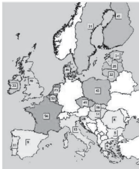
Figura 1. Mapa de Europa con indicación del nivel de formación de los profesionales de la agricultura. El verde intenso indica mayor grado de formación y el verde claro menor nivel formativo. Precision Agriculture and the future of farming in Europe. 2016. STOA IP/G/STOA/FWC-2013-1/Lot 7/SC5. Disponible en: http://www.ep.europa.eu/stoa/

La figura 1 muestra grandes diferencias en el nivel formativo de los agricultores entre los diferentes países, lo que dificulta la completa aceptación e implementación de las nuevas tecnologías y nuevos desarrollos. Por ello INNOSETA, el proyecto europeo que acaba de iniciarse, liderado por