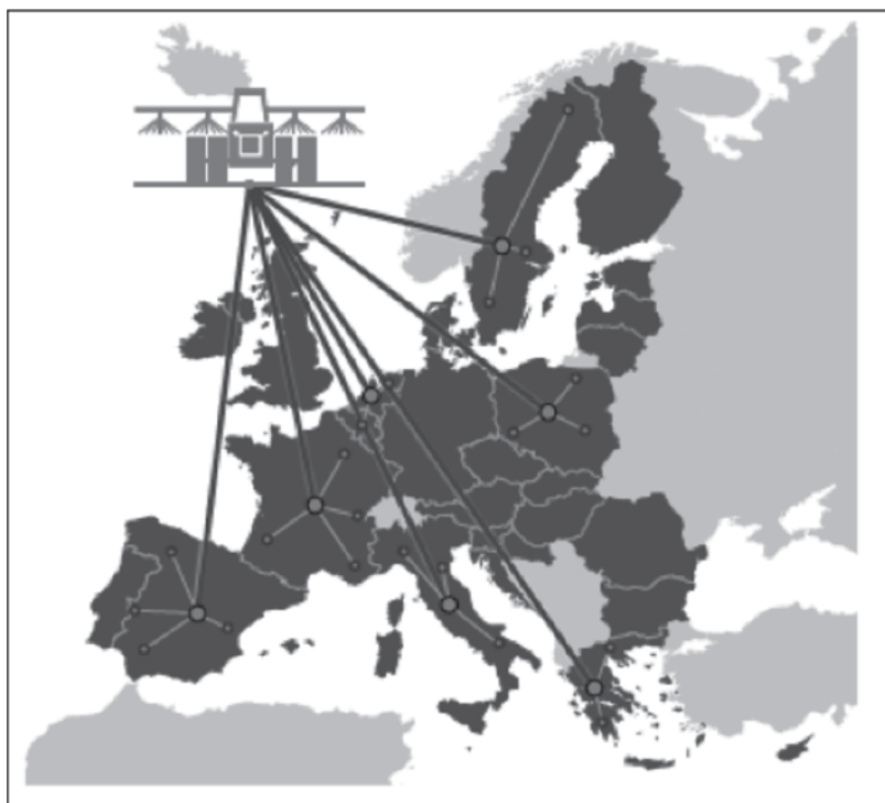
Figura 4. Países y zonas de actuación del proyecto