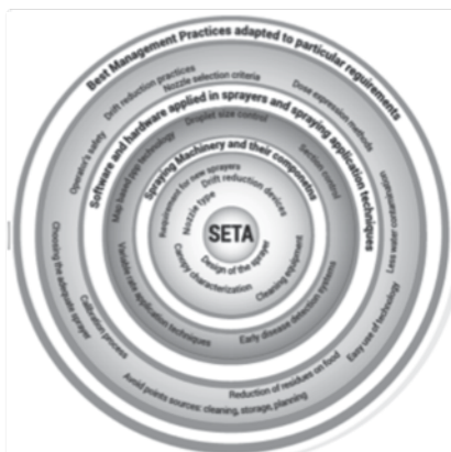
Figura 2. Círculo de actuación del proyecto INNOSETA. Los aspectos que se contemplan son: tecnologías de aplicación, nuevos desarrollos en sensores e instrumentación, material para formación y buenas prácticas fitosanitarias

Spraying, Equipment, Training and Advising (SETA) se refiere al círculo de herramientas necesarias para cubrir el uso de PPP para la protección de cultivos, incluida la maquinaria de pulverización y sus componentes, tecnologías electrónicas (software y hardware) aplicadas en pulverizadores y técnicas de aplicación de fito-