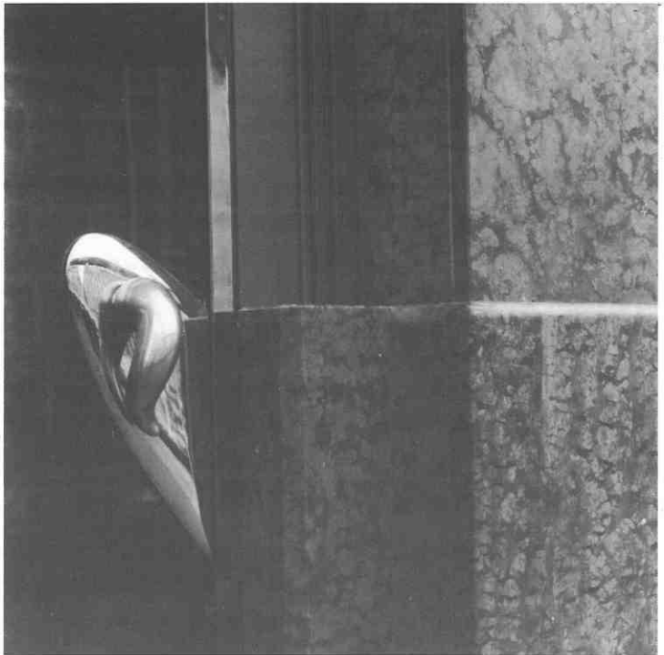
Slavomir Drinković, Držač, Ban café, Zagreb 1992/Slavomir Drinković, Supporter, Ban Café, Zagreb, 1992

Logična je potreba čovjeka da nastoji izbjeći unifikaciju koju nudi masovna proizvodnja. Mašta i fantazija cijenjene su u dizajnu jednako kao i u arhitekturi, a alternativa unificiranoj masovnoj produkciji stvorena je uvođenjem manjih manufakturnih pogona, koji mogu proizvesti očekivani predmet. Interesantno je spomenuti iskustvo Italije, zasigurno vodeće zemlje što se tiče oblikovanja. U njoj je na početku osamdesetih grupa Memphis izazivala