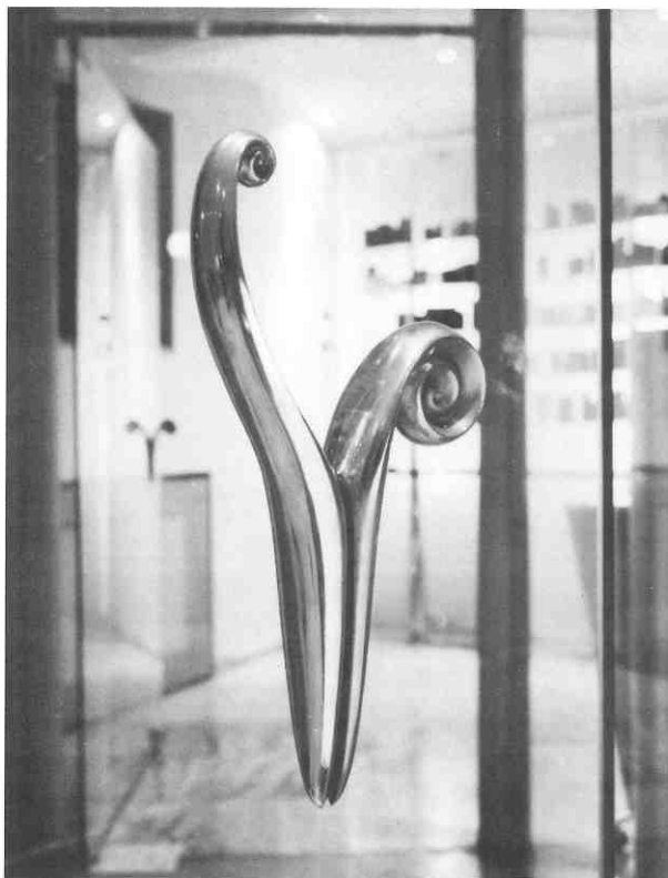
S.D., Vazica, BBK/S.D., Door handle, BBK hairstyling saloon

Everything is subordinated to the tactile, because eyes themselves are not enough to take in the entire beauty of shaping. The need for designing an object is equivalent to the need of styling hair.