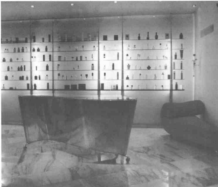
S. D., Interijer frizerskog salona BBK, Zagreb 1993./S. D., BBK hairstyling saloon entrieur, Zagreb 1993

odrediti unutar konteksta high-touch dizajna. Svojim kiparskim određenjem, pri kojemu je koncept snažno uvjetovan senzibilnim i minimalističkim promišljanjima o simbolici i rječitosti samog djela, Drinković je postavio potpuno nove kriterije poimanja oblikovanog predmeta. Mogli bismo reći da je sve započelo radom na Ban caféu, gdje je zajedno s arhitektom Nenadom Fabijanićem osivario najsuptilniji gradski interijer. Uz Ban café nezaobilazna je priča o čašama i bocama, također zajedničko oblikovanje Drinkovića i Fabijanića, koje nas vraćaju prapočelu ceremonije pijenja. Poput lagano zaobljena dlana njihove čaše pružaju istu sigurnost te ugodu dodira s tekućinom. Čaše su izrađene jednostavnom, no profinjenom gestom tordiranja, čijim se vrtloženjem vraćaju dlanu ili možda imaginarnom rogu obilja. Bez ikakve naznake napetosti staklo djeluje dovršeno nekom svojom unutrašnjom logikom kretnje. Promjenom cjelokupnog ceremonijala pijenja, jer čaše Drinkovića i Fabijanića ne mogu se odložiti uobičajenim načinom na stol, pružena je mogućnost drukčijeg odnosa prema uporabnom predmetu. Čaša je neprestano u ruci, koja pak zavija njenim tijelom jednako kako zavija prilikom uzimanja vode iz izvora. Oblik boce nastao je prostornim istraživanjem mogućnosti upotrebe stakla prilikom uređenja interijera Ban caféa. Izduženost oblika dovršena je maštovito oblikovanim čepovima, koji poput duhova zakrivljenim oblicima slobodno kreću iz boce u prostor.