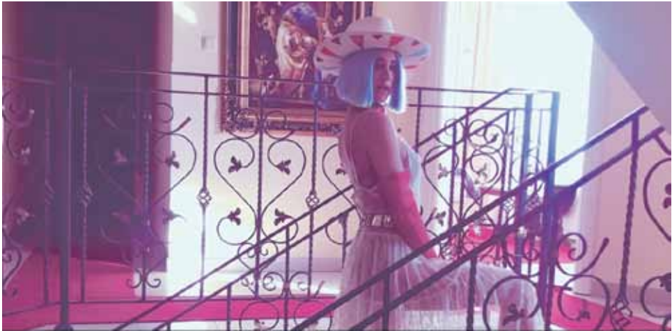
Sajsi MC: "Gepekovana" (2019). Kuvakaappaus musiikkivideosta.

koneisto, joka toimii niin työasioissa kuin yksityiselämässä – se suojaa minua peittämällä omia heikkouksiani. Minuun ei pääse tutustumaan jos en anna siihen lupaa.