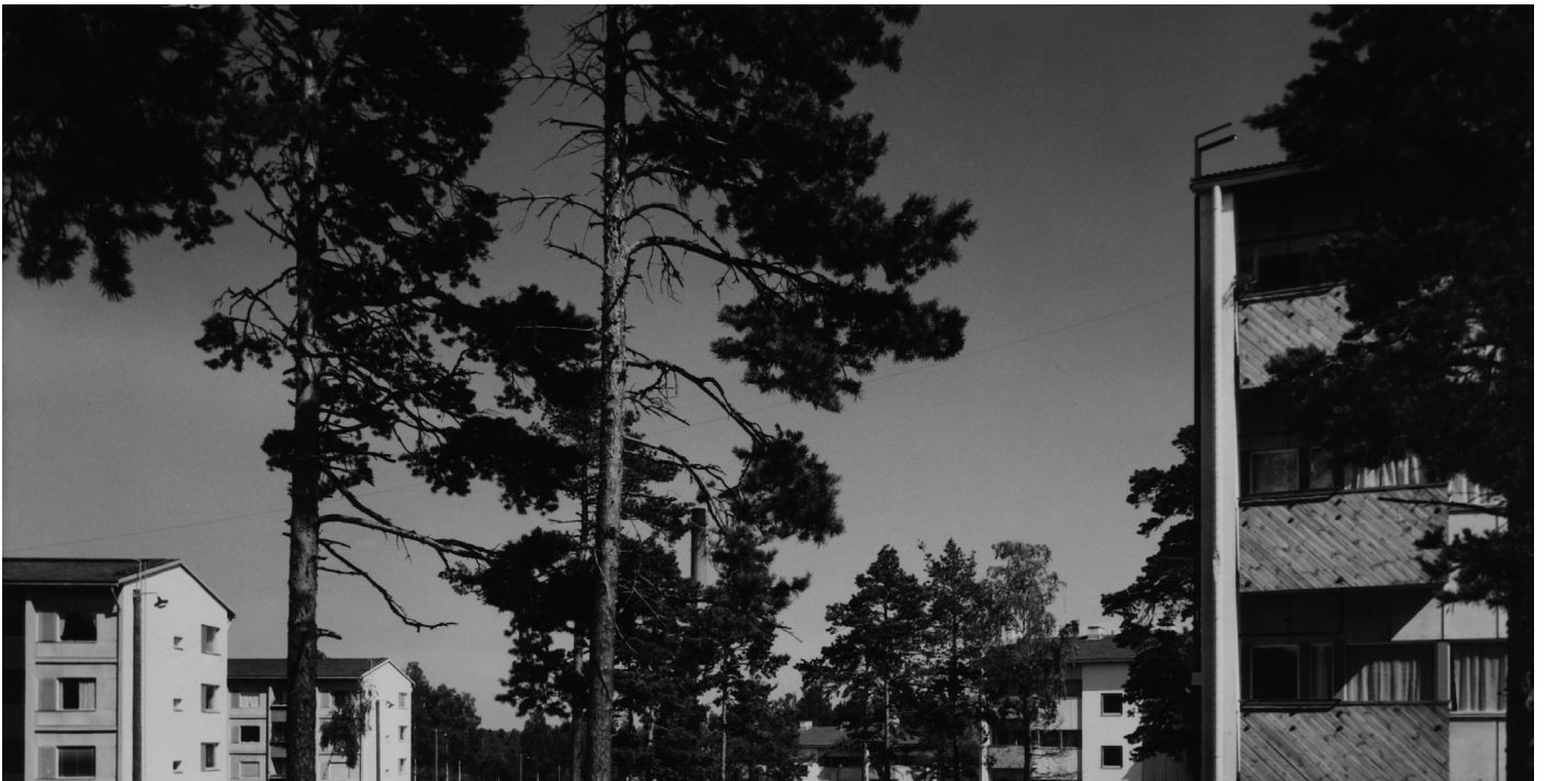
Asuinrakennuksia ja lapsia pihalla uudessa lähiössä. Ilm. 1960.