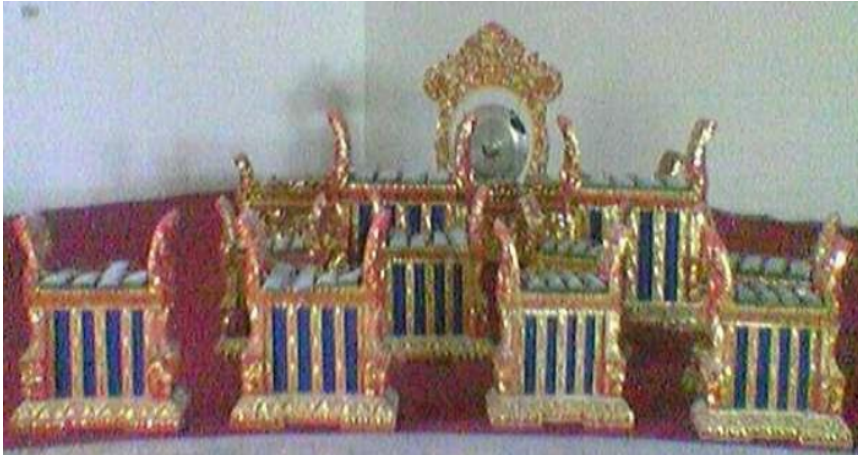
Gamelan Angklung

hingga 7 sampai 8 bilah. Gamelan sejenis ini kini lazim disebut sebagai Angklung Kebyar, yang mana mengadopsi permainan pola kekebyaran dalam teknik permainan gamelan angklung. Daerah-daerah basis angklung di Gianyar adalah Desa Sidan (Gianyar), Sayan, Kedewatan, dan Ubud.