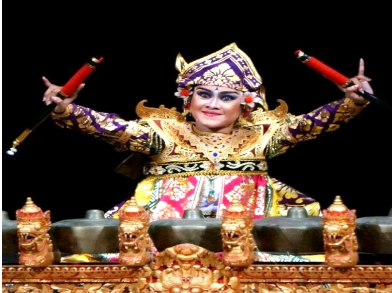
Tari Kebyar Palawakya

hingga kini masih segar bugar di Gianyar. Begitu pula Gong Kebyar yang lahir di Bali Utara, justru berkembang amat semarak di sini.