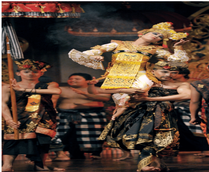
Tari Sanghyang Dedari (Dok. Istimewa)

Jika tahap ini sudah terlewati barulah mulai dengan upacara nusdus alias mengasapi. Asap menyan menyepul menyelimuti tubuh calon penari sanghyang. Lagu suci kuskus arum yang dikumandangkan koor wanita mengiringi berulang-ulang. Tanda-tanda kerauhan diketahui bila para penari mulai gemetar dan tak terkendali. Bila sudah trance , Sanghyang Jaran misalnya, menerjang api dan menendang kesana kemari, koor lagu kian bersemangat berkumandang. Sepanjang lagu dikumandangkan, penari Sanghyang akan terus bergerak yang kadang-kadang jauh di luar arena pentas, seolah-olah mengejar atau mengusir sesuatu.