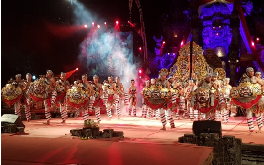
Okokan Tegalalang

Atas prakarsa masyarakat Baturiti (kabupaten Tabanan) dan Tegalalang (Kabupaten Gianyar) di mana terdapat cukup banyak instrumen okokan , alat-alat bunyi ini ditata menjadi sebuah barungan yang disebut Okokan atau Grumbungan. Di Daerah Gianyar Okokan ini berkembang di daerah Pujung Tegalalang.