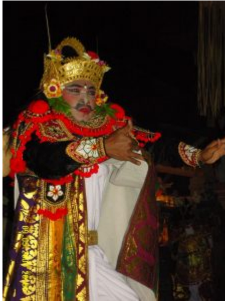
Gb. Tokoh Arya dalam Gambuh

Memasuki zaman kemerdekaan, seni pertunjukan Gambuh memang beralih fungsi dari kesenian istana menjadi seni pentas ritual keagamaan. Penampilan dramatari Gambuh selain dimaknai sebagai presentasi estetik namun juga menjadi kelengkapan upacara keagamaan. Dalam suasana komunal dan atmosfer yang religius, generasi tua dan muda para partisipan upacara keagamaan itu menyaksikan teater tradisi yang amat jarang dipentaskan itu.