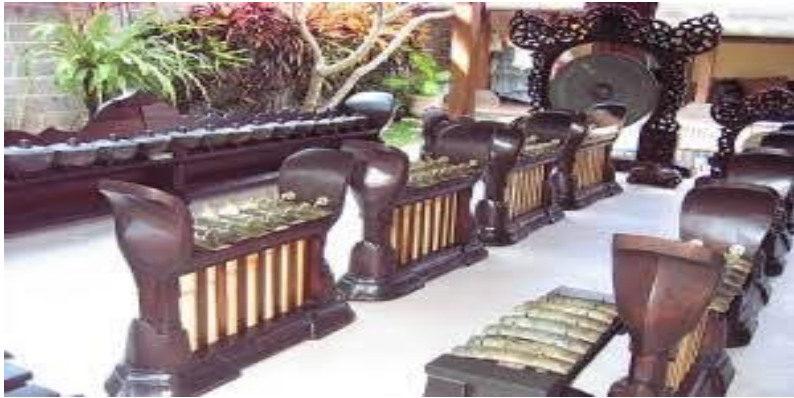
Gamelan Semara Pagulingan