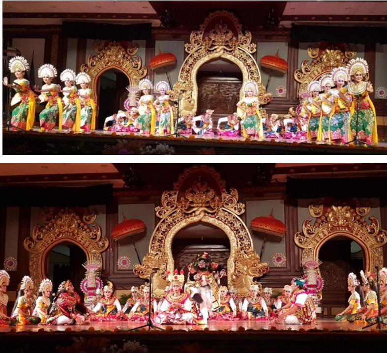
Pementasan Janger Peliatan Pada PKB ke-41 Th 2019 di Taman Budaya Denpasar

sehingga berbagai kemasan Janger muncul dengan versinya masing-masing seperti Janger Dag yang mendapat pengaruh dari komedi stambul dan busana seperti Tentara Belanda, Janger klasik (sesaputan), janger berpola drama, dan sebagainya.