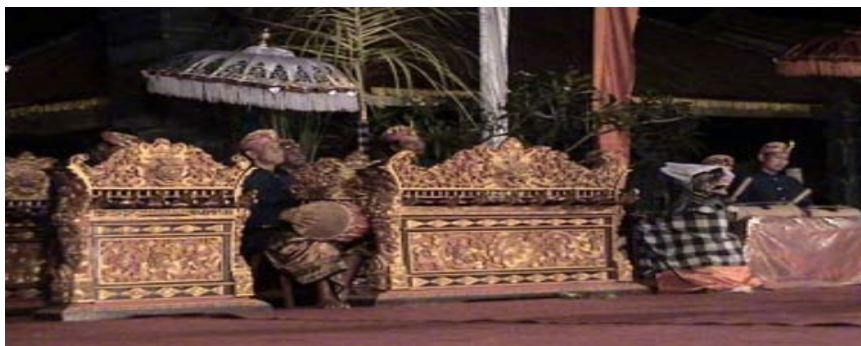
Gamelan Gandrung

walaupun tergolong sebagai bentuk tari pergaulan tetapi di dalam praktiknya menunjukkan perbedaan yang sangat menjolok dengan tari Joged bumbung pada umumnya. Tarian sejenis ini di daerah kabupaten lainnya lebih umum dikenal dengan Gandrung seperti di Ketapian dan Monang -Maning (Denpasar). Satu hal yang khas dalam tari joged pingitan adalah bahwa ketika sampai pada adegan ibingan-ibingan antara penari Joged dengan pengibing tidak boleh mendekat secara bebas leluasa, karena mereka di dalam menari dibatasi oleh ruang pembatas yang disimbolkan dengan lampu yang terbuat dari lampu sentir yang sumbunya diletakkan pada buah kelapa berisi minyak untuk pemegangannya.