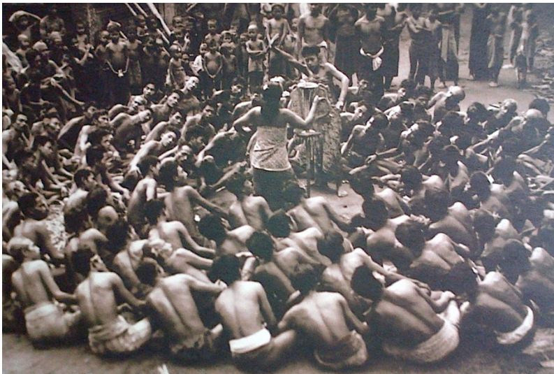
Cak Bedulu