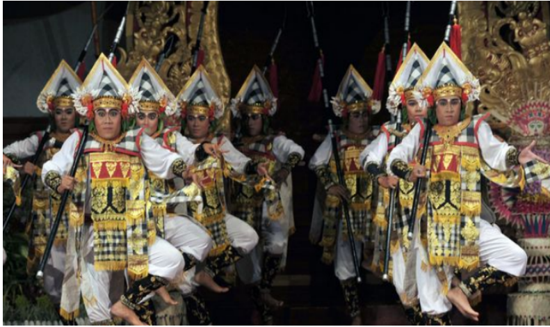
Tari Baris Gede

Tujuh penari Tari Baris Tamyang mewakili karakter-karakter yang terlibat dalam kisah Abimanyu dalam menyerang formasi gelar cakra yang mana formasi ini merupakan formasi pertahanan militer pasukan Korawa . Dikisahkan dalam perang Mahabharata , Abimanyu menyerang pasukan militer Korawa yang melakukan formasi gelar cakra untuk melindungi dan menguatkan barisan untuk menyerang musuh. Namun Abimanyu tidak sembarangan dalam melakukan penyerangan dengan seorang diri tersebut, Abimanyu telah mengetahui cara memasuki formasi gelar cakra tersebut dengan mendengarnya kala itu Abimanyu masih didalam rahim Suprabha /ibunya. Pada saat itu (didalam rahim) Abimanyu sudah sadar dan mampu bercakapan dengan kedua orang tuanya ( Arjuna dan Suprabha ) hal itu membuat Arjuna membisikkan ilmu-ilmu kemiliteran kepada Abimanyu termasuk cara menembus formasi gelar cakra . Namun konon disaat