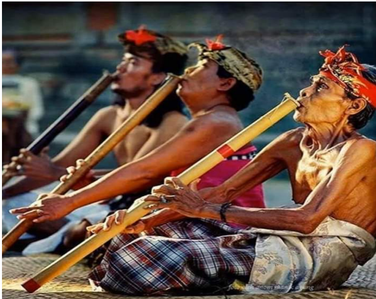
Suling Pagambuhan yang panjangnya hingga 1 meter merupakan ciri khas dalam gamelan Pagambuhan

dalam Gambuh adalah Condong, Kakan-kakan, Putri, Arya/Kadean-kadean, Panji (Patih Manis), Prabangsa (Patih Keras), Demang, Temenggung, Turas, Panasar, dan Prabu. Dalam memainkan tokoh-tokoh tersebut semua penari berdialog umumnya menggunakan bahasa Kawi, kecuali tokoh Turas, Panasar dan Condong yang berbahasa Bali, baik halus, madya, atau kasar.