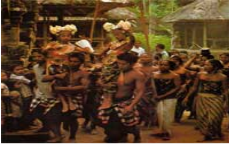
(Ilustrasi: Foto Tari Sanghyang Dedari)

Sebelum menari, kedua gadis tadi diupacarai untuk memohon datangnya Hyang Dedari ke dalam badan kasar mereka. Prosesi diiringi dengan paduan suara gending Sanghyang yang dilakukan oleh kelompok paduan suara wanita dan pria. Kedua gadis itu kemudian pingsan, tanda bahwa Hyang Dedari telah merasukinya. Kemudian beberapa orang membangunkan dan memasang hiasan kepalanya, kedua gadis dalam keadaan tidak sadar, dibawa ke tempat menari. Di tempat menari, kedua gadis kecil itu diberdirikan di atas pundak dua orang pria yang kuat. Dengan iringan gamelan Palegongan, kedua penari menari-nari di atas pundak kemudian si pemikul berjalan berkeliling pentas. Gerakan tarian yang dilakukan mirip dengan tari Legong . Selama tarian berlangsung, mata kedua gadis itu tetap tertutup rapat. Menari di atas bahu seseorang tanpa terjatuh, tidak mungkin dilakukan oleh gadis-gadis cilik dalam keadaan sadar, apalagi biasanya si gadis belum pernah belajar menari sebelumnya. Sungguh menakjubkan. Tarian suci ini diadakan dalam upacara memohon