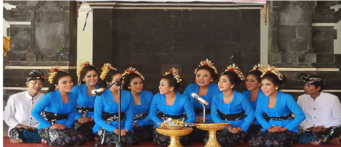
Sekaa Kidung

kata dan bunyi akhir pada setiap bait dari pada jumlah suku kata dan bunyi akhir pada setiap larik atau baris.