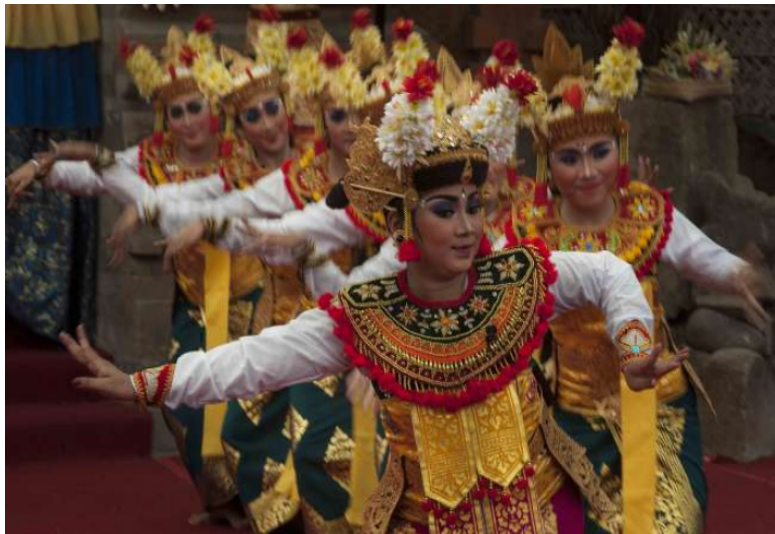
Dramatari Gambuh (Dok. Istimewa)

Pada era keemasan raja-raja Bali, khususnya pada masa Dalem Waturenggong (1416-1550), tari Gambuh adalah seni pertunjukan prestisius kesayangan seisi istana. Namun ketika kolonialisme kemudian menggedor Bali yang menggerogoti kekuasaan kaum bangsawan, Gambuh limbung. Sekarang, seni pertunjukan yang diduga berasal dari Majapahit dan jejak-jejaknya sudah muncul di Bali saat pemerintahan Udayana pada abad ke-11 ini, mulau dibangkitkan lagi.