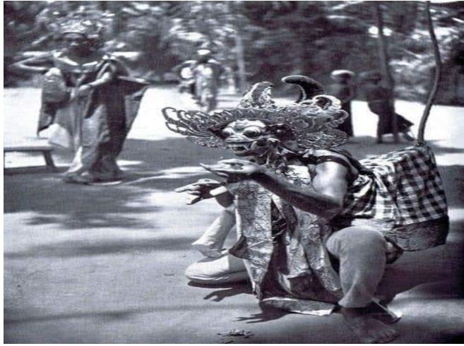
Dramatari Wayang Wong