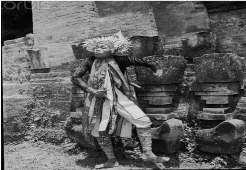
Tari Baris