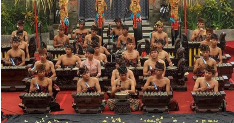
Gong Gede Saih Pitu