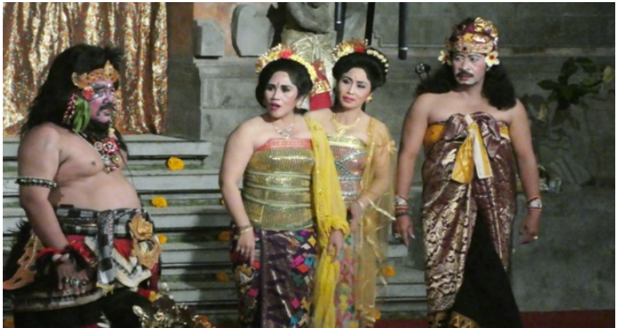
Drama Gong

bonan , tidak nyebun seperti Abianbase antara lain, Drama Gong Duta Bon Bali, Bintang Bali Timur, dan Drama Gong Sancaya Dwipa. Berkembangnya Drama Gong tersebut telah mampu mengalahkan popularitas tari Arja yang juga berkembang sangat pesat sekitar tahun 1970, sampai tahun 1980-an.