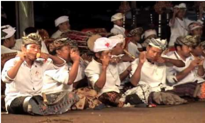
Gamelan Genggong

atas jelaslah bahwa Genggong adalah alat musik yang muncul sebagai akibat peniruan bunyi. Alat musik ini tergolong tua dan telah tersebar di seluruh dunia dengan bermacam bentuk dan versi. Khususnya di Desa Batuan, musik ekologis ini -karena bersumber dari bahan yang ada di lingkungannya- muncul dan dikembangkan melalui pertemuan tidak resmi atau waktu-waktu tarluang oleh para petani Desa Batuan zaman dulu melalui acara minum tuak.