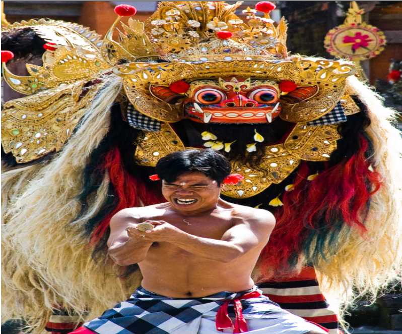
Tari Barong dan Keris

Indonesia. Pada awalnya tari ini merupakan pengganti pertunjukan singa sesungguhnya dalam sirkus oleh orang-orang yang mengadakan perjalanan, mengikuti festival, dan mencari dana.