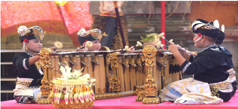
Gender Wayang

Barungan gamelan geder wayang terdiri dari empat tungguh yaitu dua tungguh pemade dan dua tungguh kantil. Gamelan ini dibuat dari perunggu dengan sepuluh bilah, dengan laras selendro dengan teknik pukulan dua tangan, resonatornya terbuat dari bamboo dan sistem larasnya menggunakan sistem ngumbang ngisep.