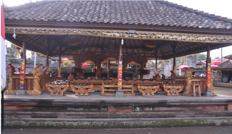
Gambar. Gamelan Gong Gede

( lelambatan ) dan mengiringi tari-tarian upacara seperti Baris dan Rejang.