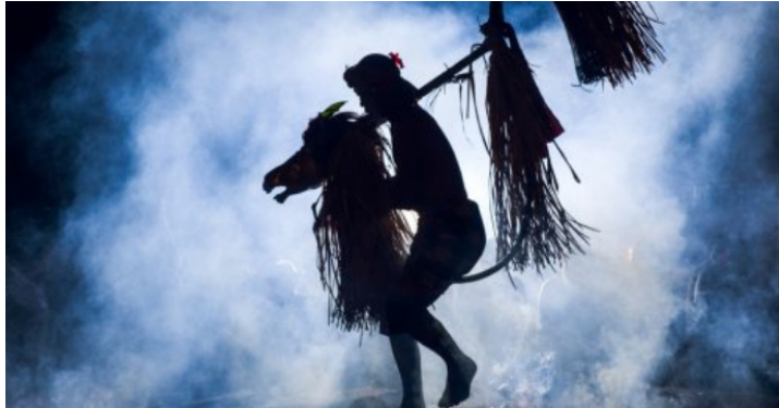
Tari Sanghyang Jaran

Karakteristik masyarakat Bali Kuna sebelum masuknya sistem kerajaan adalah kebersamaan, yaitu segala sesuatu diputuskan bersama, berdasarkan musyawarah mufakat di antara tetua adat dan masyarakat. Landasan musyawarah dan mufakat itu adalah rasa kebersamaan dalam mempertahankan keutuhan tradisi dan nilai kemasyarakatan . Tradisi dalam masyarakat Bali Kuna, didasari oleh kepercayaan pada kekuatan alam. Menurut Laeyendecker (1983:11), kesadaran yang kuat terhadap tata kosmos yang diciptakan dan dipelihara oleh Tuhan menyebabkan sikap kolektivitas lebih kuat daripada sikap individu . Tata kosmos dalam hal ini adalah keteraturan alam yang sangat berpengaruh pada kehidupan manusia. Keteraturan alam yang dimaksud dalam hal ini antara lain, siang dan malam , panas dan dingin , hujan dan kemarau , semuanya ditata oleh Tuhan. Atas dasar pemikiran Layendecker itu, masyarakat Gianyar pada jaman para Hindu mempercayao keteraturan alam sebagai kehendak Tuhan dan mengutamakan kebersamaan dalam segala hal. Hasil kreativitas seni dianggap sebagai hasil bersama, sehingga seni bukan untuk kepentingan individu tetapi diciptakan bersama untuk memuja