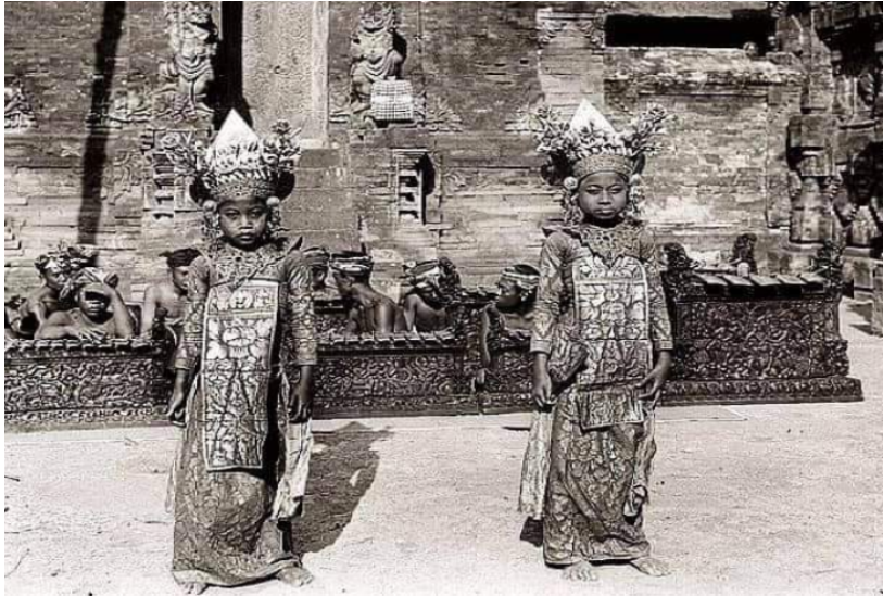
Tari Legong

Berdasarkan penjelasan di atas maka tari Legong diciptakan di Sukawati, Gianyar sebagai kesenian Puri yang kemudian berkembang ke seluruh Bali. Nilai estetika tari Legong sangat tinggi, sehingga tari Legong dapat dianggap sebagai identitas tari Bali. Dikatakan sebagai identitas tari Bali, karena setiap tari Bali yang ditarikan oleh wanita baik itu, tari pendet, Tari oleg, tari panyembrahma, dll, disebut tari Legong, pada hal tidak ada tari Legongnya. Kantong-kantong seni pertunjukan yang ciptaanya menyebar keseluruh Bali bahkan dunia berada di daerah Gianyar, seperti Singapadu dan Kuaramas dengan Arjanya, Saba dan Peliatan dengan tari Legongnya.