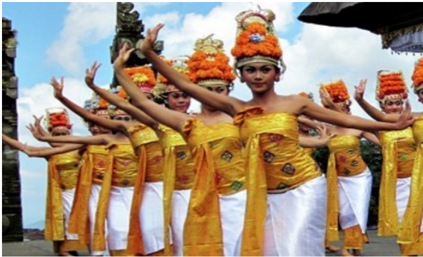
Tari Rejang Dewa (Dok. Istimewa)