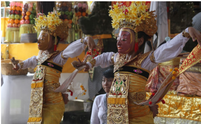
Tari Sanghyang Topeng Pura Payogan Agung (Doks. Istimewa)

masing pura yang ada di desa sekabupaten Gianyar memiliki jenis seni pertunjukan tari Sanghyang . Di Pura Penataran Sasih Desa Pejeng merupakan pura warisan jaman Bali Kuna, selalu digelar tari Sanghyang setiap ada upacara piodalan, begitu juga di beberapa pura di Ubud, di Pura Goa Gajah Desa Bedulu, di Desa Bona, Blahbatuh yang juga memiliki tari Sanghyang Dedari dan Sanghyang Jaran , di desa Camanggon Sukawati juga setiap tahun sekali digelar tari Sanghyang Dedari , di Pura Payogan Agung desa Ketewel, juga ada tari Sanghyang yang disebut dengan Sanghyang Legong atau Sanghyang Topeng .