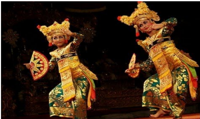
Tari Legong Keraton