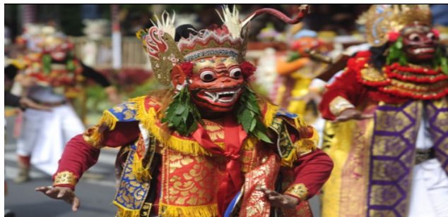
Dramatari Wayang Wong

Penyajian Parwa Sukawati masa itu disuguhkan dengan tata busana dan tata rias muka yang sederhana. Semua penari menggunakan busana yang sederhana tanpa sama sekali ada polesan ornamen kuning emas praba. Gelungan dan tapel (punakawan Malen, Merdah, Delem dan Sangut) merupakan warisan yang kurang terawat. Demikian pula tata rias mukanya menggunakan bahan-bahan alami seperti pamor untuk warna putih, adeng atau mangsi untuk warna hitam, dan daun base untuk warna merah. Kendati dengan serba seadanya, ekspresi seni tari dan tabuh yang dipersembahkan hadir mantap.