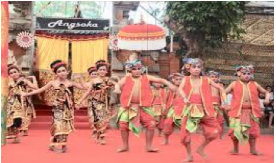
Dolanan (Dok. Istimewa)

Satu hal yang perlu dicatat bahwa dengan penguasaan nyanyian dolanan , anak-anak tidak saja terhibur dalam permainan yang diiringinya, tetapi juga menjadi cara yang cerdas untuk mendidik mental anak ke arah kejujuran, objektif, sportif, ketangkasan, ketajaman intelektual, dan sikap kreatif. Anak-nak yang curang pasti dikucilkan, yang kalah menerima dengan besar hati, dan walaupun mereka sempat bertengkar tidak sampai bermusuhan. Dalam konteks budaya, yang terpenting adalah sejak usia dini mereka telah dibiasakan untuk mengenal nada-nada musik tradisi, yakni titi laras ding-dong (pelog-selendro) sebagai modal untuk mempelajari aspek budaya Bali lainnya.