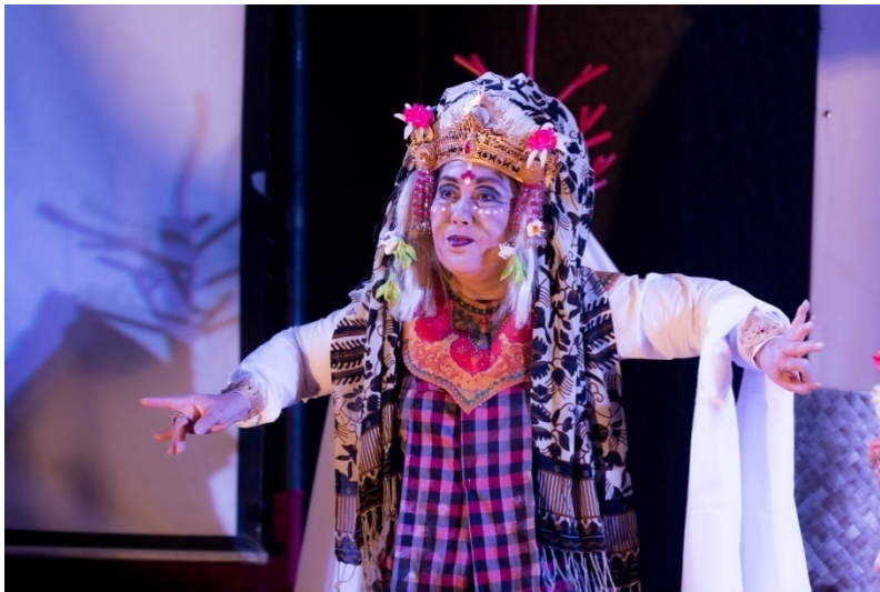
Gb. Sosok Matah Gede yang merepresentasikan Karakter Calon Arang

penduduk banyak yang sakit mendadak, wabah terjadi dimana-mana, sehingga dilakukan ronda oleh rakyat (bondres). Kesal akan situasi kerajaan yang kacau akhirnya Raja memerintahkan Patih Taskara Maguna untuk mengamankan situasi. Dengan sigap Sang Patih menyebar pasukan pengintai ( seserep telik sandi ) menantang kesaktian Walunateng Dirah. Singkat cerita keduanya saling adu kesaktian, Walunateng berubah wujud jadi Rangda (simbol ilmu hitam) dan Taskara Maguna berubah wujud jadi Barong (simbol kebajikan) akhirnya Walunateng Dirah dapat dikalahkan.