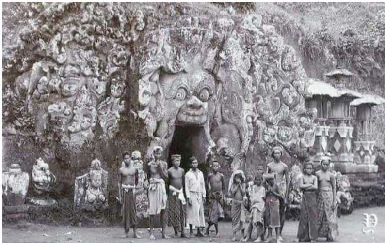
Candi Goa Gajah (Dok. Istimewa)

sosial ( sociefac ), merupakan fakta sosial tentang keberadaan seni pertunjukan yang ada saat ini. Sumber kebendaan ( artefac ) cukup banyak ditemukan pada relief-relief Candi dan peninggalan arkeologi lainnya disepanjang sungai petanu dan pakerisan dapat memberikan informasi tentang perkembangan seni kria, lukis dan juga seni pertunjukan melalui adegan-adegan yang dilukiskan. Sumber pemikiran ( mentifac ) tentang kebijakan raja banyak ditemukan dalam prasasti yang memuat berbagai jenis seni pertunjukan dan klasifikasi seni antara seni istana dan seni kerakyatan. Sumber sosial ( Sociefac ), adalah bukti seni pertunjukan sebagai warisan sejarah masih hidup dan berkembang di Gianyar.