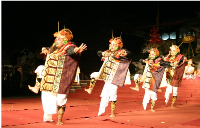
Dramatari Gambuh Batuan

Untuk menghadirkan nilai, simbol dan norma tersebut, maka kreativitas seni pertunjukan mulai memasukan cerita. Melalui cerita akan dapat dinarasikan kebesaran raja, moral, nilai agama yang dianut oleh seorang raja dalam menjalankan kekuasaan. Oleh karena itu berbagai jenis seni pertunjukan bercerita dapat diasumsikan muncul pada jaman kerajaan, terutama jaman kerajaan Bali ketika masuknya pengaruh Majapahit. Salah satu seni pertunjukan itu, adalah dramatari Gambuh yang sangat subur perkembangannya di daerah Gianyar. Dramatari Gambuh, sumber ceritanya adalah cerita Panji yang diperkirakan muncul pada masa kejayaan Majapahit. Pada waktu itu, Raja Hayam Wuruk disebut sebagai salah seorang penari yang pandai memerankan tokoh Panji. Disamping itu juga berkembang dramatari Wayang Wong di Gianyar yang menggunakan sumber cerita dari epos Mahabarata dan Ramayana.