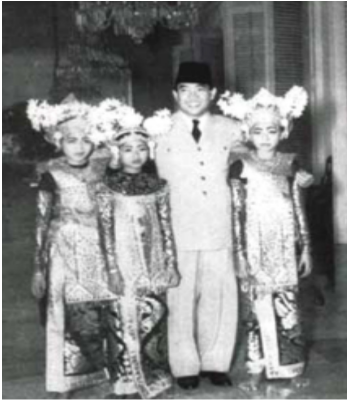
Bung Karno dengan para penari Legong

Kunjungan pejabat negara ke Gianyar selalu memicu berkembangnya berbagai kreativitas seni dan yang paling pokok dipikirkan oleh para seniman seni pertunjukan adalah menciptakan tari penyambutan agar tidak menggunakan tari sakral. Tari pendet adalah tari Sakral, sehingga muncul tari Gabor yang diciptakan oleh I Gusti Gede Raka dari Saba, Gianyar, yang kemudian di sepuhkan lagi, terutama tabuhnya oleh bapak I Wayan Berata. Dengan adanya pergolakan politik tahun 1964, antara Partai Komunis Indonesia (PKI) dengan Partai Nasionalisme Indonesia, muncul seni pertunjukan