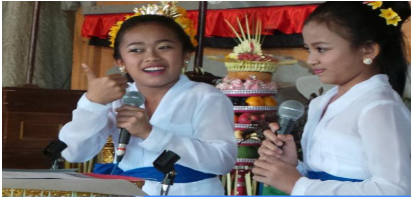
Tradisi Mekakawin

Dalam pembacaan kakawin yang menggunakan huruf atau aksara Bali, maka suatu suku kata dinyatakan guru apabila sebuah huruf menggunakan sandangan tedong , berhulu sari , masuku ilut , mataleng , mabisah , masurang , macecek , dan segala yang matengenan . Selain itu, setiap huruf yang menghadapi guwung , menghadapi nanya , dan menghadapi suku kembang .