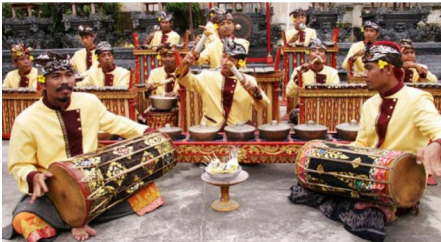
Gong Luang

Gamelan gong luang merupakan barungan gamelan pertama yang dapat dianggap paling lengkap, karena telah menggunakan beberapa instrument yang sudah ada sebelumnya. Kelengkapan instrumen itu dapat dicermati dari terpadunya instrument berbentuk bilah seperti, gangse jongkok, saron dan gambang (bilah bambu) dengan instrument berbentuk pencon seperti, tromping, kempur, dan gong. Instrumen kendang juga sudah dimasukan ke dalam barungan gong luang hanya saja fungsinya terbatas hanya sebagai aksentuasi menjelang jatuhnya pukulan gong dalam akhir sebuah lagu.