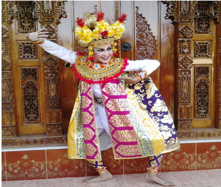
Tokoh Mantri dalam Arja (Dok. Suartaya)

Seni pertunjukan arja adalah sebuah opera Bali yang elemen utamanya terdiri dari tari, drama, dan nyanyian. Penyajian seni pentas musikal teater ini protokoler. Setiap tokoh melantunkan tembang tersendiri sesuai dengan wataknya ketika baru pertama muncul dalam sebuah pementasan. Kendati lakonnya berbeda namun struktur dramatik teater ini baku. Dan pola yang lazim dalam seni pentas arja, di akhir cerita tokoh zalim pasti dapat dikalahkan oleh pahlawan kebenaran.