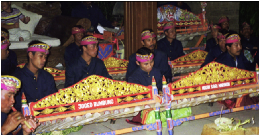
Gamelan Jaged Bumbung (Dok. Istimewa)

sudah dilengkapi dengan grantang (rindik) suwir dan grantrang jegog. Fungsi gamelan ini untuk mengiringi tari pergaulan yang disebut jaged karena diringi dengan bumbung bambu maka disebut jaged bumbung. Tarian ini berfungsi sebagai hiburan masyarakat yang biasanya disajikan usai musim panen. gamelan ini pada jaman dahulu terdapat di Desa Bukit Jangkrik (Gianyar), Tegal Tamu, Batubulan (Sukawati).