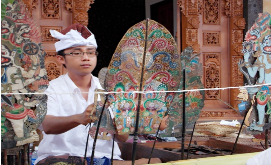
Wayang Kulit Sukawati

yang disebut terakhir adalah dalang-dalang muda yang sempat mengenyam pendidikan formal pedalangan pada Sekolah Tinggi Seni Indonesia (STSI) Denpasar. Dalang angkatan tahun 2000 adalah dalang cilik I Bagus Bharatanatya.