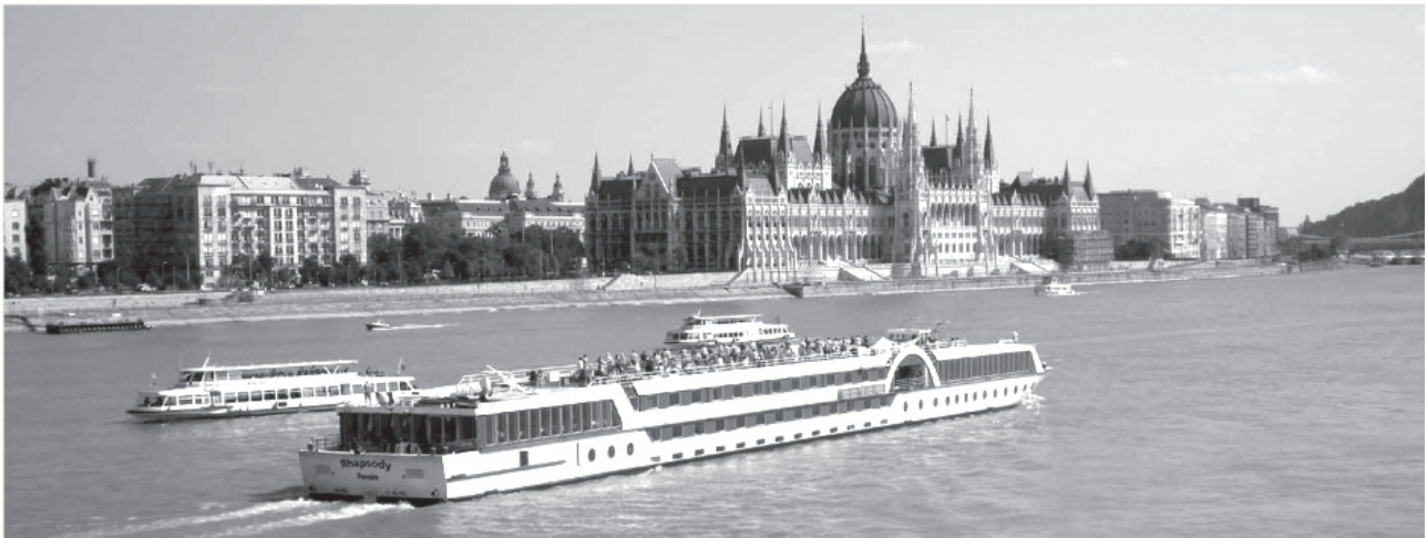
3. ábra: A parlament a Dunáról