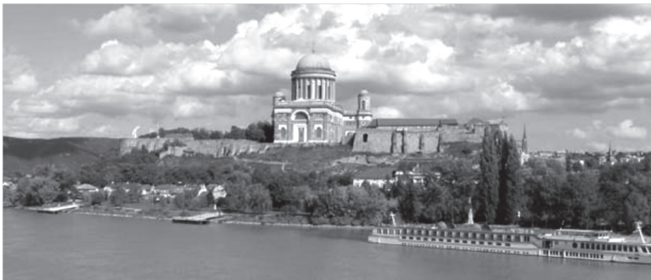
2. ábra: Az esztergomi bazilika a Dunáról