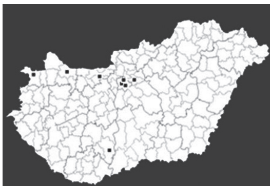
5. ábra: Turizmusképzési intézmények a magyarországi Duna Régióban 2012-ben (saját szerkesztés)

Ha kitekintünk a külföldi képzésekre, a Duna Régió tekintetében a következő képet láthatjuk (3. táblázat):