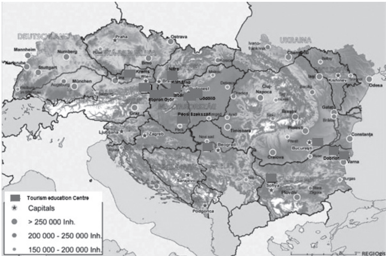
6. ábra: Felsőfokú turizmusképzés a Duna Régióban

Megvizsgálva a Duna Régió menti, főbb turizmusképzési repertoárját megállapítható, hogy hazánk képviseli a legszélesebb körben a turisztikai szakemberképzés lehetőségét.(6.ábra)