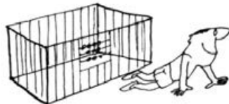
mert a rossz példa ragadós