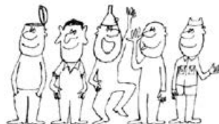
arcátlan, csúnya, felelőtlen, tiszteletlen, lealacsonyító...