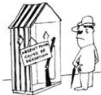
mert nem elégans (a tábla felirata: dezertálás miatt távol)