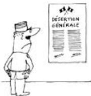
mert irigységet szül (a plakát felirata: általános dezertálás)