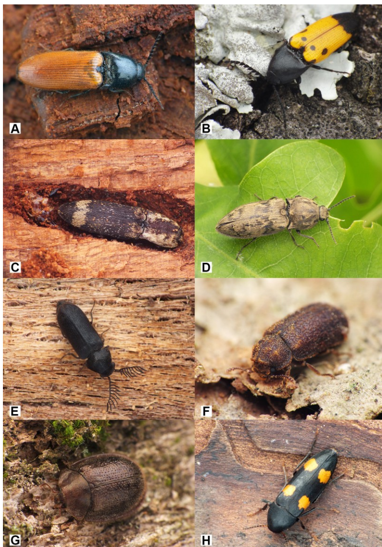
2. ábra. Naszályra új bogárfajok I. A: Ampedus nigroflavus (GOEZE, 1777) – feketesárga pattanó, B: Ampedus quadrisignatus (GYLLENHAL, 1817) – négyfoltos pattanó, C: Lacon querceus (HERBST, 1784) – tarka pikkelyespattanó, D: Prosternon chrysocomum (GERMAR, 1843) – nagy kockáspattanó, E: Pseudoptilinus fissicollis (REITTER, 1877) – hársfűró álszú, F: Endecatomus reticulatus (HERBST, 1793) – recés álcuklyásszú, G: Thymalus limbatus (FABRICIUS, 1787) – bronzfényű korongbogár, H: Dircaea australis (FAIRMAIRE, 1856) – déli komorka. Az ábrák nem méretarányosak.

Figure 2. New beetle species for the Naszály Hill I. A: Ampedus nigroflavus (GOEZE, 1777), B: Ampedus quadrisignatus (GYLLENHAL, 1817), C: Lacon querceus (HERBST, 1784), D: Prosternon chrysocomum (GERMAR, 1843), E: Pseudoptilinus fissicollis (REITTER, 1877), F: Endecatomus reticulatus (HERBST, 1793), G: Thymalus limbatus (FABRICIUS, 1787), H: Dircaea australis (FAIRMAIRE, 1856). Figures are not to scale.