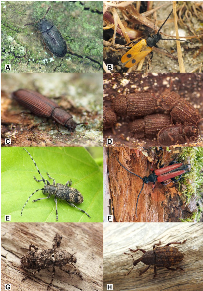
3. ábra. Naszályra új bogárfajok II. A: Tetratoma desmarestii LATREILLE, 1807 – szőrös álkomorka, B: Apalus bimaculatus (LINNAEUS, 1760) – kétfoltos élősdibogár, C: Pycnomerus terebrans (A. G. OLIVIER, 1790) – bordás héjbogár, D: Eledonoprius armatus (PANZER, 1799) – érdes taplóbogár, E: Oplosia cinerea (MULSANT, 1839) – foltos hárcincér, F: Stictoleptura erythroptera (HAGENBACH, 1822) – bordó virágcincér, G: Gasterocercus depressirostris (FABRICIUS, 1792) – laposorrú ormányos, H: Plinthus sturmii sturmii GERMAR, 1818 – bordáshátú földiormányos. Az ábrák nem méretarányosak (fotók: NÉMETH T.).

Figure 3. New beetle species for the Naszály Hill II. A: Tetratoma desmarestii LATREILLE, 1807, B: Apalus bimaculatus (LINNAEUS, 1760), C: Pycnomerus terebrans (A. G. OLIVIER, 1790), D: Eledonoprius armatus (PANZER, 1799), E: Oplosia cinerea (MULSANT, 1839), F: Stictoleptura erythroptera (HAGENBACH, 1822), G: Gasterocercus depressirostris (FABRICIUS, 1792), H: Plinthus sturmii sturmii GERMAR, 1818. Figures are not to scale (photos by T. NÉMETH).