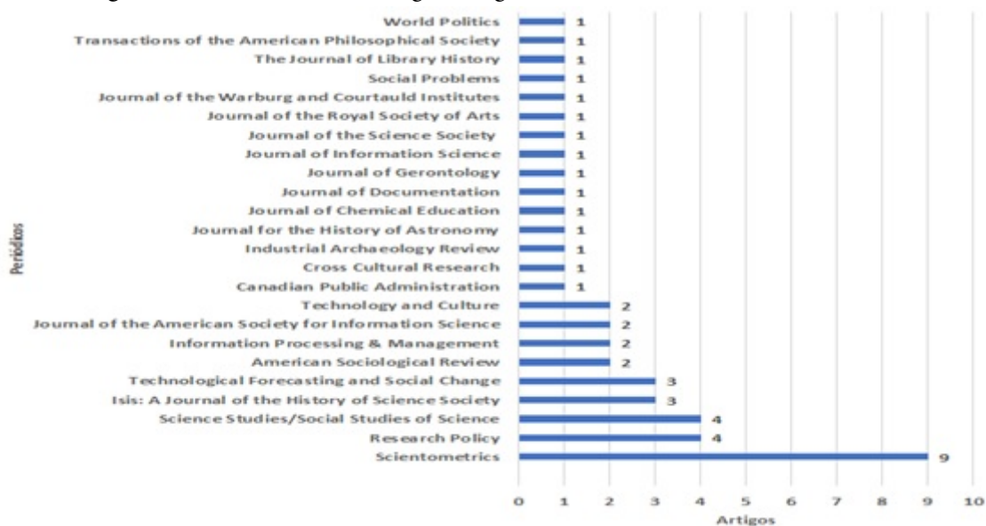
Figura 2 – Periódicos com artigos de agradecimentos a Derek de Solla Price.

A Figura 2 apresenta os títulos de periódicos (n=24) que publicaram os artigos com agradecimentos a Price.