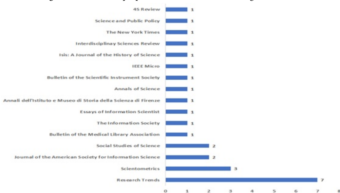
Figura 4– Periódicos que publicaram obituários, homenagens e tributos.

Os obituários, tributos e homenagens póstumas a Price (n=26) foram publicados em diversos periódicos científicos (n=15) e em um jornal de grande circulação norte-americano ( The New York Times ), conforme mostram os dados da Figura 4.