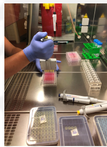
Abb. 1: Aussäen der Caco-2 Zellen.

Bei den Toxizitätstests wurde ein CTB Test und Neutralrot Test durchgeführt. Für beide Methoden wurden die Caco-2 Zellen in eine 96-well Platte ausgesät (Abb. 1). Die Zellen wurden dann mit den Azofarbstoffen in An- und Abwesenheit von Titandioxidnanopartikeln inkubiert und im Anschluss die Toxizitätsbestimmung durchgeführt (Abb. 2).