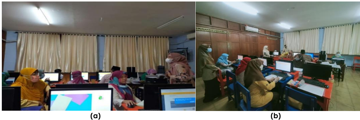
Gambar 2. Pemateri memberikan penjelasan terkait dengan langkah-langkah restore (a) Peserta mempraktikkan langkah-langkah restore (b)

Sesi kedua adalah pelatihan tentang langkah-langkah Restore , program ini diberikan ke peserta sebagai tujuan agar data-data bahan ajar yang telah dibuat oleh guru-guru bisa dikembalikan ke tempat semula atau awal setelah selesai melakukan pencadangan data. Tidak berbeda jauh dengan sesi pertama, dalam sesi kedua ini, setelah peserta diberikan penjelasan terkait dengan langkah-langkah restore , peserta diberikan sesi tanya jawab dan setelahnya diberikan kesempatan untuk mempraktikkan langkah-langkah restore dengan di dampingi oleh tim pemateri.