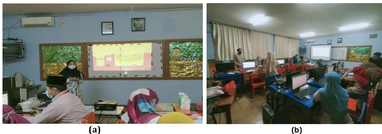
Gambar 1. Pemateri menjelaskan tentang back up data (a) Peserta mempraktikkan langkah back up (b)

Pelatihan e-learning berbasis moodle ini diberikan kepada guru Sekolah Dasar Islam Harapan Ibu Pondok Pinang Jakarta Selatan. Pada hari pertama, Hari Rabu Tanggal 9 Juni 2021 pelatihan e-learning diberikan terlebih dahulu kepada guru-guru kelas 1-3, dengan jumlah peserta sebanyak 12 orang dan di hari kedua pada hari Kamis, 10 Juni 2021 diberikan pelatihan untuk guru-guru kelas 4-6 sebanyak 12 orang. Sesi pertama, peserta diberikan gambaran dan penjelasan terkait dengan back up data yang ada di program moodle.