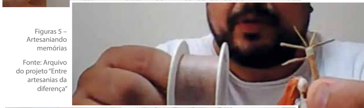
Figuras 5 – Artesaniando memórias