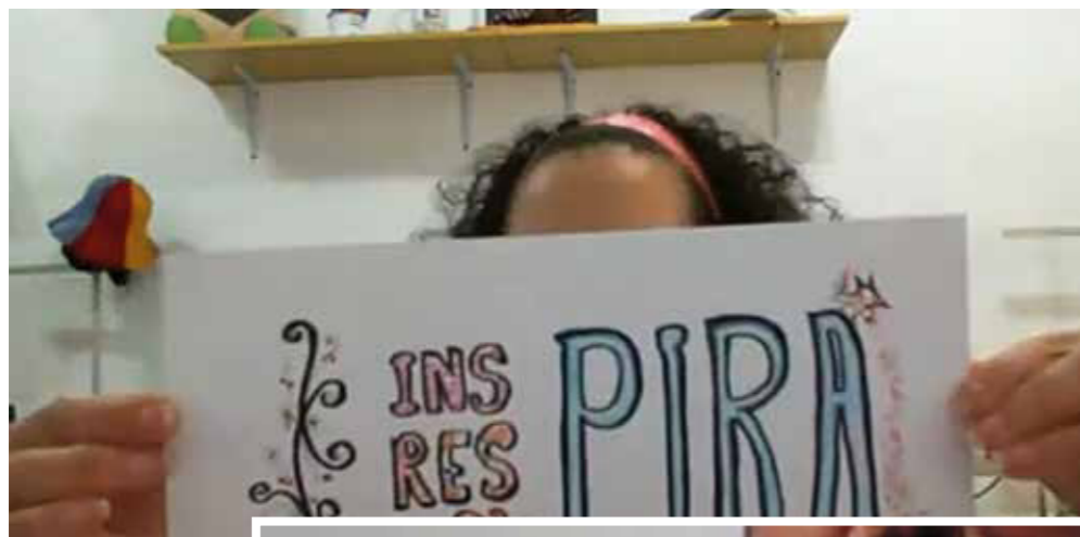
Figuras 4 – Artesaniando sonhos