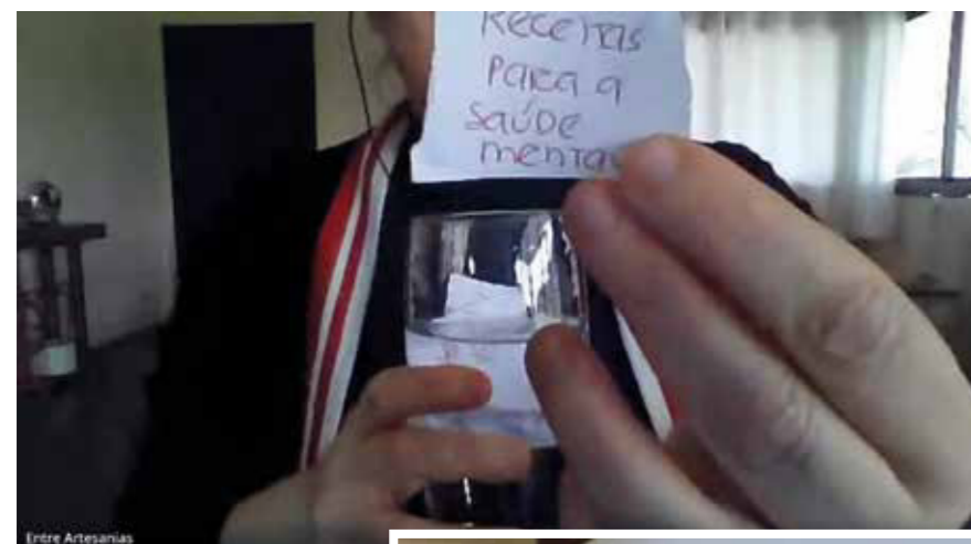
Figuras 2 e 3 – Captura de imagens das gravações do encontro

“Consegui imaginar fazendo algo similar dentro de uma sala de aula com os alunos. A questão do ouvir o outro para entender e não para responder. Juntamente com o fazer artístico, expressar cada um da sua maneira e conhecer o outro e também trabalhar o autoconhecimento”. (ENTRE ARTESANIAS/ERE, 2020).