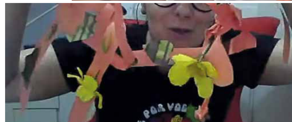
Figuras 6 – Artesaniando possibilidades