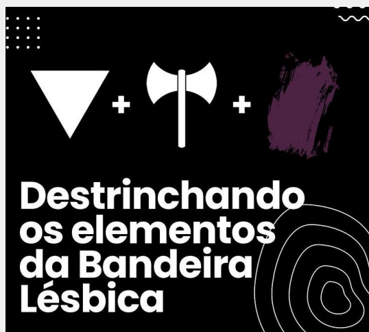
Figura 4. “Destrinchando os elementos da bandeira lésbica”