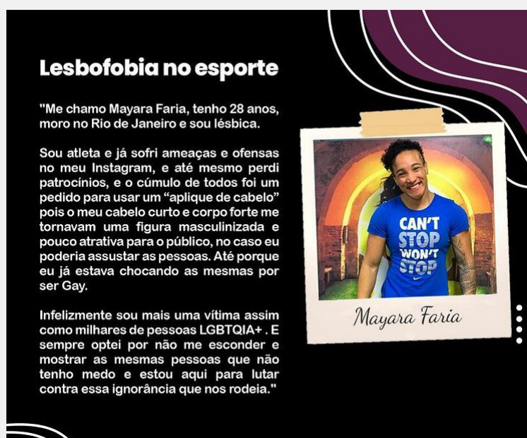
Figura 1. “Lesbofobia no esporte”