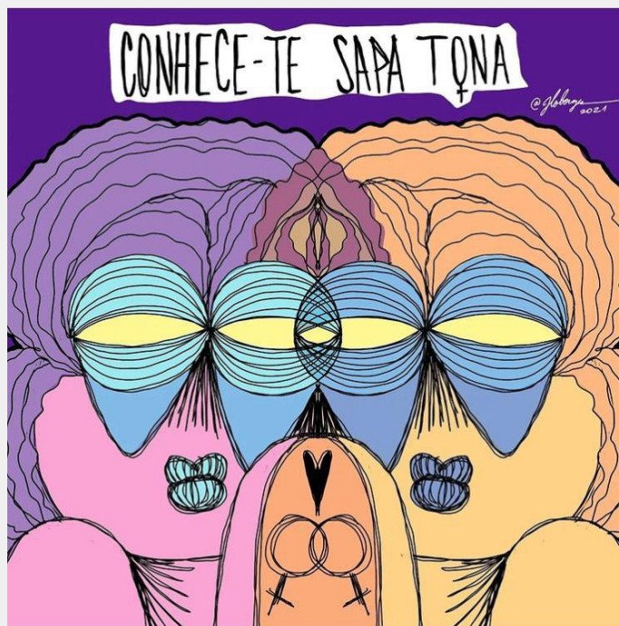
Figura 3. “Conhece-te sapa tona”