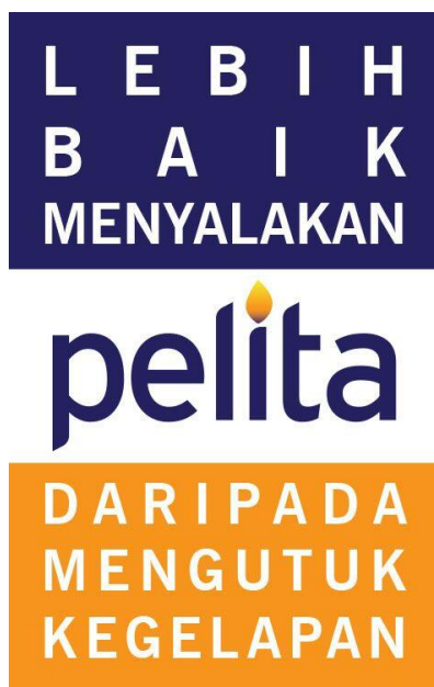
Gambar 2. (Sticker dan Jargon PELITA)

Terdapat jargon utama dari Persudaraan Lintas Agama (PELITA). Jargon tersebut memiliki makna filosofis tersendiri yang sesuai dengan harapan dibentuknya PELITA. “Lebih baik menyalakan pelita dari pada mengutuk kegelapan” demikian bunyinya. Hal ini sesuai dengan logo pelita yang terdapat gambar lilin didalamnya. Jargon tersebut bisa dilihat melalui stiker yang dimiliki oleh Persaudaraan Lintas Agama kota Semarang.