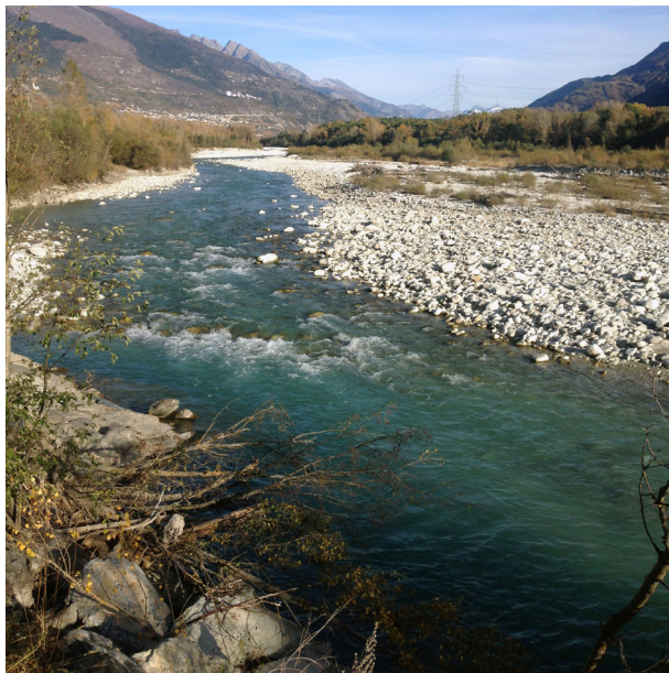
Figure 3-La zone alluviale de Finges, classée d'importance nationale, est comprise dans l'objet IFP.