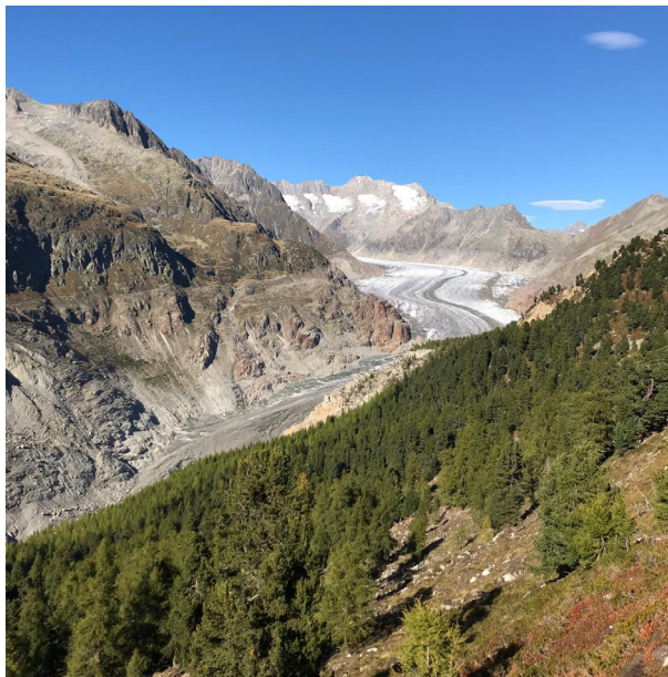
Figure 2 - La forêt d'Aletsch est une réserve naturelle Pro Natura, elle-même incluse dans l'objet IFP.