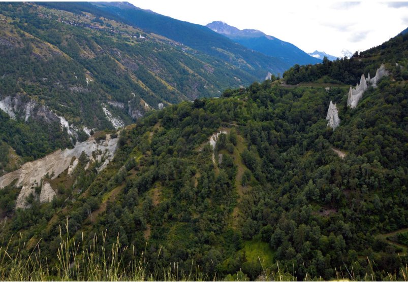
Figure 5 - Pyramides d'Euseigne: l'objet IFP couvre une surface bien plus grande que les pyramides elles-mêmes; tout le versant se trouve dans l'objet classé à l'IFP.

mais également les milieux naturels situés à proximité, est également un support pour la biodiversité.