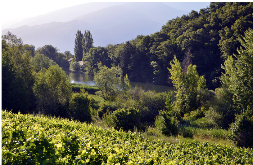
Figure 4 - Proximité de parcelles de vignes privées et du site protégé de Montorge.

Les enjeux de gestion sont similaires à ceux de Valère et Tourbillon; l'entretien est un enjeu supplémentaire. Pour maintenir, voire améliorer, la diversité des milieux naturels, des travaux d'entretien réguliers sont nécessaires. Ces