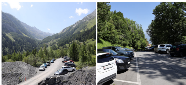
Figure 7 - Stationnement à Derborence (à gauche) et à Tanay (à droite).

En 2019, plusieurs sites connaissaient une augmentation de l'afflux de visiteurs. Cette tendance a été encore plus marquée durant l'été 2020, la pandémie de coronavirus ayant poussé les Suisses à rester au pays durant les vacances. Derborence et Tanay ont fait parler d'eux en raison de leur surfréquentation et des problèmes de stationnement. L'augmentation générale de visiteurs constatée dans la majorité des sites peut s'expliquer par les prestations paysagères qu'ils offrent telles que le plaisir esthétique ou encore la détente/santé. L'afflux de visiteurs peut engendrer des dégradations des valeurs naturelles et paysagères du site. À Derborence, la gestion des déplacements et des comportements des visiteurs est facilitée par des mesures légales (arrêté de protection du Conseil d'Etat) et toute personne au comportement non conforme peut se voir verbaliser. D'autres sites, comme Finges ou le Val de Réchy-Sasseneire bénéficient d'une protection légale plus ou moins restrictive. A Finges, il n'y a aucune interdiction de cheminer hors des sentiers officiels. Le site de Tanay