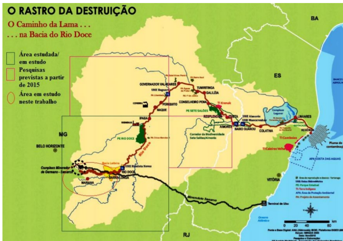
Figura 1 – Localização da área das áreas estudadas/em estudo e com pesquisas previstas pelo Grupo de Pesquisas em Recursos Hídricos do ProAmb/UFOP Fonte: FERNANDES, 2017, p. 6.

Para a comprovação disto, tem-se esta figura produzida pela mesma autora nos seus estudos de dissertação: