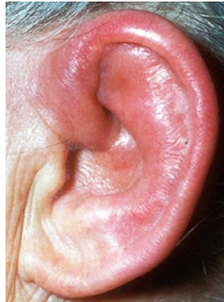
Abb. 2 ▲ Perichondritis