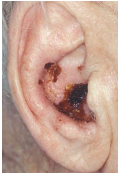
Abb. 1 ▲ Zoster oticus