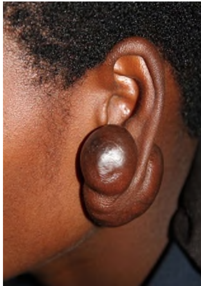
Abb. 6 ► Ausgeprägte Keloidbildung bei einer ugandischen Patientin