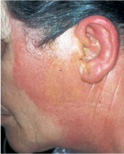
Abb. 4 ▲ Erysipel