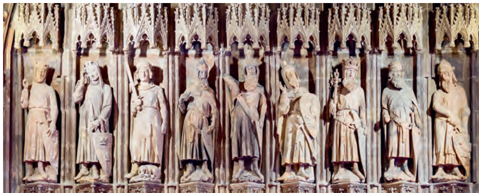
Afb. 1 De Negen Besten. Beeldengroep in het stadhuis van Keulen (ca. 1330).

droegen de helden heraldische fabelwapens. Daarmee werden ze afgebeeld in handschriften en op houtsneden, gravures, wandtapijten, gebruiksvoorwerpen etc. In een hoofse context werden de Negen Besten opgevat als voorbeeldige ridders, maar in het geval van stedelijke receptie van het thema overheerste het idee dat het om rechtvaardige vorsten ging.