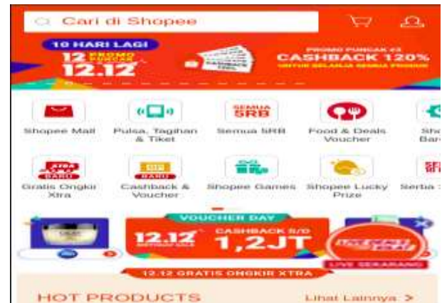
Gambar 2. Halaman Utama

Pada gambar satu ini adalah tampilan halaman utama pada aplikasi Shopee yang dapat diakses melalui browser pada laptop. Tampilan tersebut memiliki tampilan yang cukup baik serta memiliki fitur yang lengkap yang terdiri dari super flash sale, shopee supermarket, shopee mall, shopee food, murah lebay, serta memiliki kategori yang cukup lengkap mulai dari barang elektronik, bahan makanan, perawatan kecantikan, perlengkapan rumah tangga, perlengkapan kesehatan serta perlengkapan bayi, pada tampilan ini pengguna bisa memilih yang meraka ingin cari