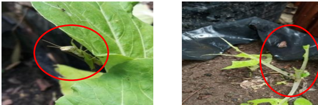
Gambar 1. Serangan Belalang Hijau ( Valanga nigricornis ) pada Tanaman Tumpang Sari Sawi Sendok

Bentuk-bentuk kerusakan tanaman tumpang sari sawi sendok akibat serangan hama belalang kayu, dapat dilihat pada Gambar 1.