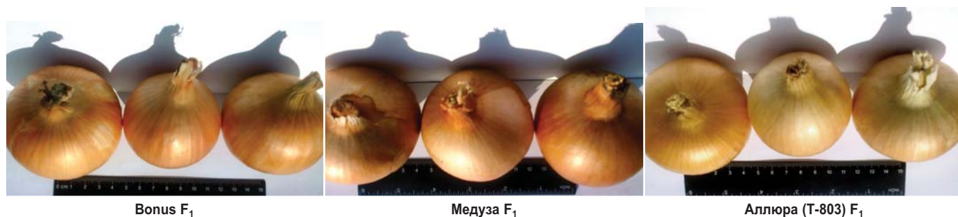
Рис. 4. Луковицы выделенных образцов лука репчатого, 2017 год Fig. 4. Bulbs of selected onion samples, 2017

EYG 155 F 1 . По итогам трехлетних испытаний высокой общей и товарной урожайностью – более 30 т/га и более 20 т/га соответственно, характеризовались образцы Медуза х Bonus, Аллюра F 1 .