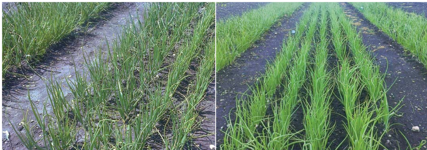
Рис. 1. Коллекционный питомник лука репчатого, СКФ ФГБНУ ФНЦО, 2017 год Fig. 1. The collection nursery of onion, SKF FSBSI FSVC, 2017

делянки – 5 м 2 (3,33 погонных метра посевной ленты), повторность – 4-х кратная. Размещение делянок рендомизированное. Посев – вручную сухими семенами с последующим прикатыванием. Стандарты – новые сорта Примо и Ампэкс селекции ФГБНУ ФНЦО и итальянский гибрид F 1 Ранко, которые размещали через каждые 10 коллекционных образцов (рис. 1).