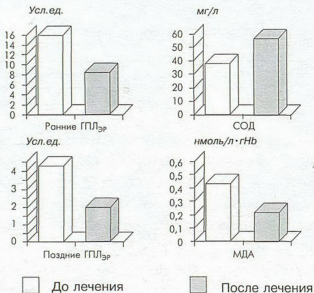
Рис.1. Динамика показателей ПОЛ-АОС в группе больных, получавших цитохром С.

Проводимая терапия у больных основной группы сопровождалась нормализацией процессов ПОЛ: уровень поздних ГПЛ эп и МДА эп снизился с 4,21 \pm 0,1 до 1,99 \pm 0,1 усл. ед. и с 0,503 \pm 0,03 до 0,231 \pm 0,02 нмоль/л·гНв, p < 0,001 соответственно по сравнению с исходными данными (рис.1). Активность лизосомальных ферментов, в частности бета-