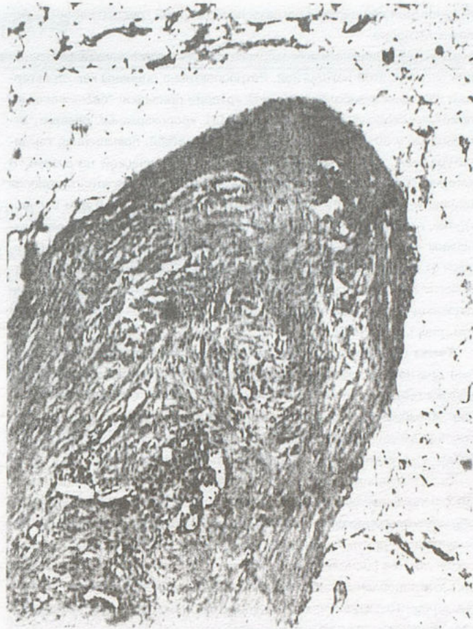
Рис.2. Гистологический срез участка подкожной клетчатки с венозным сосудом. Окраска гематоксилином и эозином \times 120 .

Отмечалось затяжное течение с упорным кровохарканьем. Проводился дифференциальный диагноз с туберкулезом, опухолевым заболеванием легкого, желудка, кишечника. Произведены: рентгеноско-