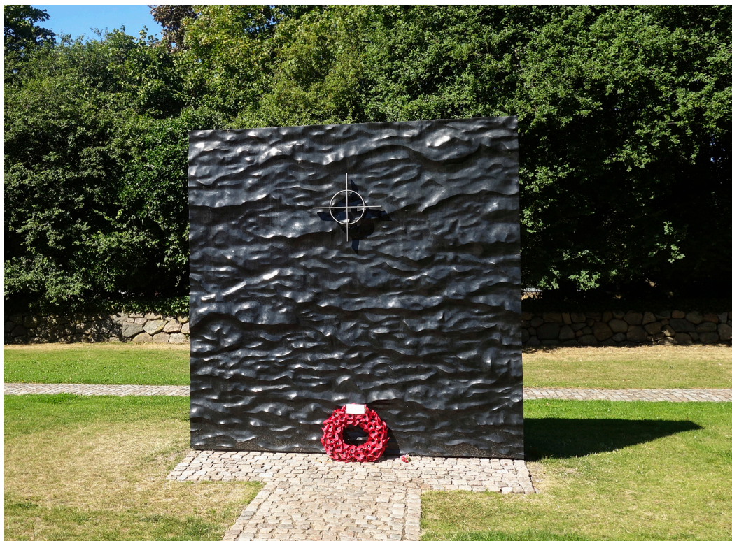
Mindesmärke for krigssejlere.