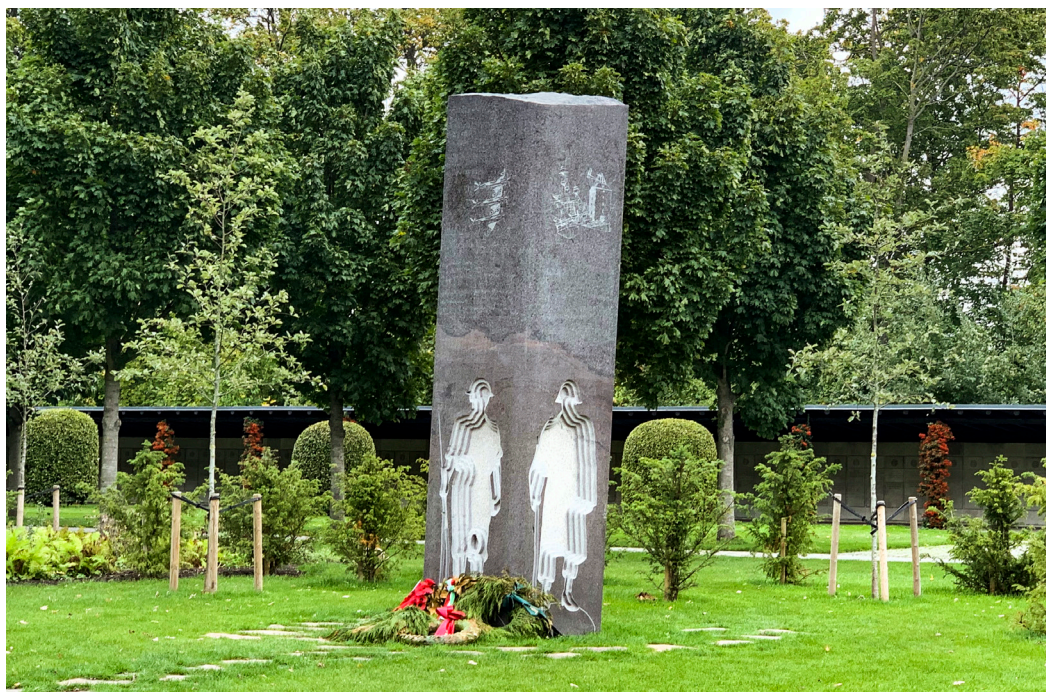
Mindesmärke for danske soldater.