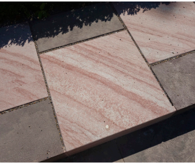
Et eksempel på udskiftede og oprindelige sten på gravfeltet.