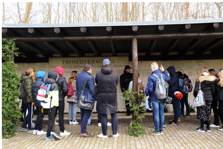
Omvisning i Mindelunden.

en computerskærm. Fascinationen ved at lade et hårdt materiale som sten opløse sin egen karakter ved at ligne noget helt andet, eksempelvis hud og tøj eller som hér vand, kender vi særligt fra barokkens skulptur. Denne type illusion er, så langt man kan komme fra modernismens ide som muligt. Bjørn Nørgaards værk refererer mere tydeligt til nogle ældre traditioner, i og med at det ligner, og er, en stele, men også her er de centrale figurer, de to soldater og deres krigsinstru-