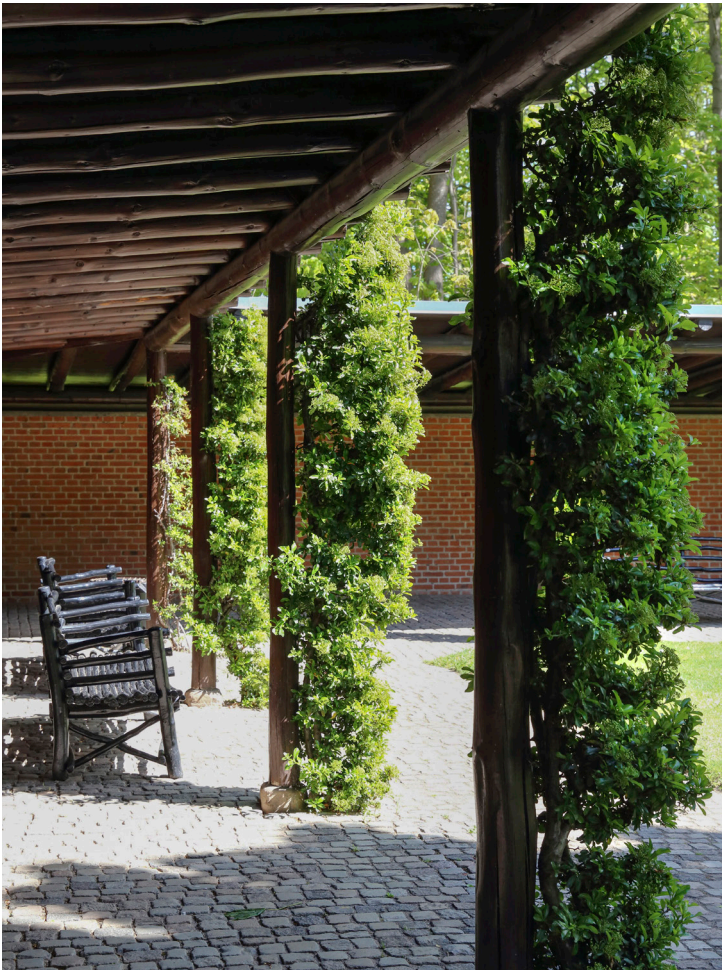
Bænke i pergolaen.

I de seneste par år er der sket en transformation, der har betydet ny og aktiv formidling i Mindelunden. Der er ansat en uddannelses- og kommunikationsansvarlig, og der udvikles dialogbaserede omvisninger med forberedelsesmateriale til folkeskoler, konfirmandhold og gymnasier. 25 Antallet af