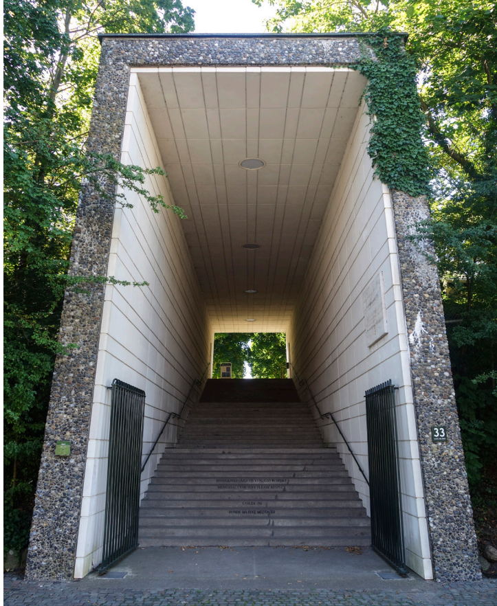
Portalen fra Tuborgvej til Mindelunden.