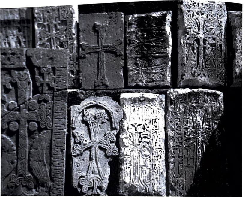
Grupo de khatchkars dos séculos IX-XI.