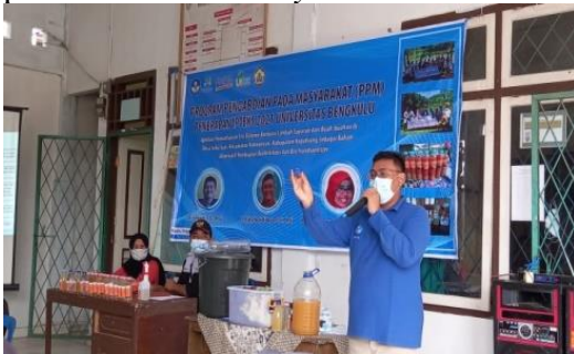
Gambar 4. Pemberian penyuluhan materi Eco-enzyme

Sosialisasi tim Program pengabdian pada masyarakat (PPM) tentang penyuluhan dan pembuatan Ecoenzyme dilaksanakan pada hari Kamis, 19 Agustus 2021 dan bertempat di Balai Desa Suka Sari, diawali dengan penyuluhan materi pengabdian bersama kelompok tani dan warga Desa Suka Sari, di Balai Desa Suka Sari, Kecamatan Kabawetan, Kabupaten Kepahiang. Kegiatan pengabdian dihadiri oleh peserta sebanyak 19 orang terdiri dari orang tua dan remaja. Kegiatan tahap pertama PPM dilakukan dengan penyampaian materi dari tim pengabdian mengenai aplikasi pemanfaatan Ecoenzyme .