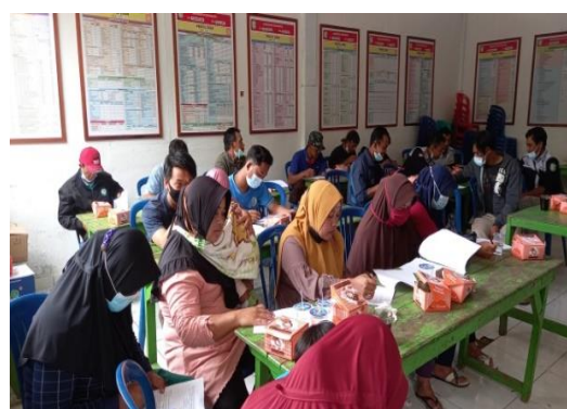
Gambar 7. Pengisian kuisisioner pretest oleh peserta pengabdian

Evaluasi kegiatan pengabdian aplikasi pemanfaatan ecoenzyme dengan memberikan kuisisioner sebagai umpan balik kepada peserta dalam memahami kegiatan pengabdian, peserta diberikan kuisisioner tahap pretest dan post test . Pemberian kuisisioner pretest diberikan sebelum penyuluhan materi pengabdian sedangkan pada tahap post test diberikan sesudah penyuluhan materi pengabdian dan demonstrasi pembuatan ecoenzyme . Dari hasil kuisisioner tahap pretest menunjukkan rata-rata persentase 'tidak tahu' lebih besar dibandingkan pilihan jawaban tahu ataupun ragu-ragu. Hal ini menunjukkan peserta pengabdian belum mengetahui detail tentang ecoenzyme baik dari segi bahan dan cara pembuatan ecoenzyme serta manfaatnya.