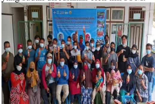
Gambar 6. Foto bersama seluruh Tim dan peserta pengabdian aplikasi pemanfaatan Ecoenzyme

Menurut Yanti (2020), demonstrasi dan pelatihan yang dilakukan setelah sosialisasi memberikan manfaat yang penting bagi peserta untuk lebih paham dengan materi yang disampaikan ketika sosialisasi. Tim pelaksana pengabdian masyarakat memberikan ilmu pengetahuan kepada peserta secara langsung dengan mempraktekkan cara membuat Ecoenzyme menggunakan alat seperti ember dan pengaduk serta bahannya berupa limbah sayuran dan kulit buah-buahan, air dan gula merah yang sudah disediakan oleh tim PPM.