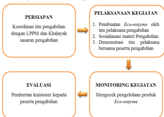
Gambar 1. Skema Pelaksanaan Pengabdian pada Masyarakat (PPM) berbasis IPTEKS

Metode pelaksanaan pada program pengabdian masyarakat (PPM) berbasis IPTEKS dengan judul aplikasi pemanfaatan Ecoenzyme berbasis limbah sayuran dan buah-buahan di Desa Suka Sari, Kecamatan Kabawetan, Kabupaten Kepahiang sebagai bahan alternatif pembuatan Bio-handsanitizer dan Biofertilizer memiliki beberapa tahapan yaitu tahap persiapan meliputi koordinasi tim terlebih dahulu dengan LPPM dan khalayak sasaran pengabdian untuk didapatkan surat perizinan di Desa Suka Sari, Kecamatan Kabawetan. Tahap pelaksanaan pengabdian terdiri dari tiga tahapan yaitu pembuatan produk ecoenzyme oleh tim pengabdian sebagai sampel awal, sosialisasi dengan memberikan pendidikan dan pelatihan cara pembuatan dan manfaat Ecoenzyme sebagai bahan alternatif pembuatan Biohandsanitizer (antiseptik) dan Biofertilizer (pupuk organik cair) kemudian demonstrasi yang dilakukan oleh tim pelaksana kepada warga dan para kelompok tani di Desa Suka Sari dengan mempraktekkan dan mengajarkan warga terkait teknik pembuatan Ecoenzyme .