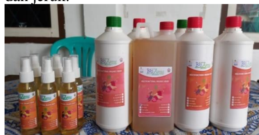
Gambar 3. Produk Ecoenzyme sebagai bio-handsanitizer dan biofertilizer

Proses pembuatan ecoenzyme melalui tahap fermentasi selama tiga bulan dengan mencampurkan air, limbah organik (sayuran dan buah-buahan) dan gula merah dengan perbandingan 10:3:1. Menurut Harahap (2021), hasil fermentasi ecoenzyme berasal dari kulit buah, sayur, gula merah dan akuades dengan perbandingan kulit buah (kulit jeruk, nenas dan pisang) atau sayur sebesar 30% dan air 60% serta gula merah 10%. Sayur yang digunakan merupakan limbah dari pertanian yang tidak terpakai seperti kulit sayur kol dan sawi. Produk ecoenzyme disimpan di dalam botol selama 2-3 bulan. ecoenzyme yang berasal dari satu jenis sampah/limbah warnanya akan terlihat lebih cerah dan bau lebih spesifik seperti wangi nanas dan jeruk.