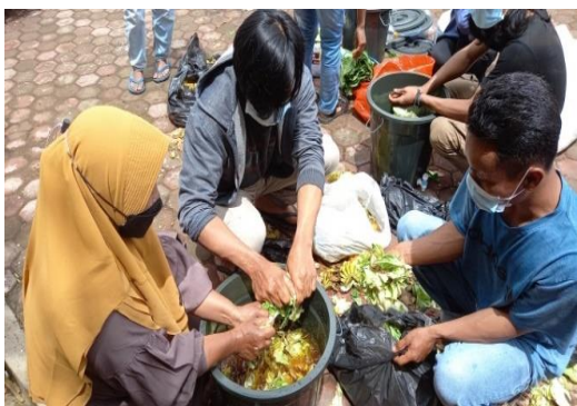
Gambar 5. Pelatihan pembuatan Eco enzyme bersama kelompok tani

Menurut Yanti (2020), demonstrasi dan pelatihan yang dilakukan setelah sosialisasi memberikan manfaat yang penting bagi peserta untuk lebih paham dengan materi yang disampaikan ketika sosialisasi. Tim pelaksana pengabdian masyarakat memberikan ilmu pengetahuan kepada peserta secara langsung dengan mempraktekkan cara membuat Ecoenzyme menggunakan alat seperti ember dan pengaduk serta bahannya berupa limbah sayuran dan kulit buah-buahan, air dan gula merah yang sudah disediakan oleh tim PPM.