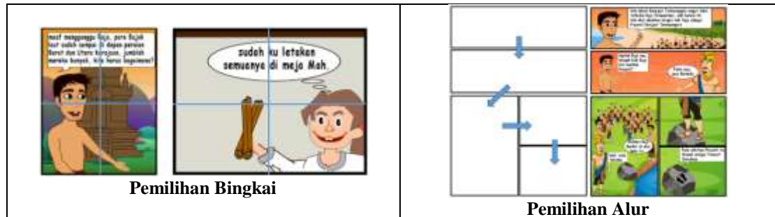
Gambar 2. Pemilihan bingkai dan Pemilihan alur

b. Pemilihan bingkai dan Pemilihan alur. dapat dilihat pada gambar 2 di bawah ini: