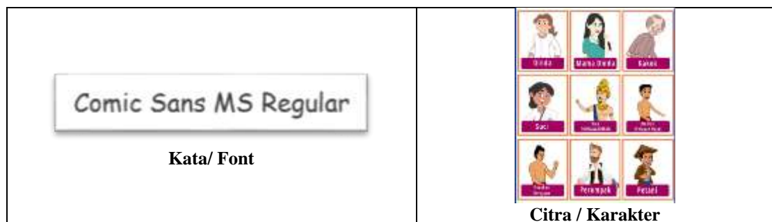
Gambar 3. Pemilihan bingkai dan Pemilihan alur

c. Pemilihan kata dan Pemilihan citra. dapat dilihat pada gambar 3 di bawah ini: