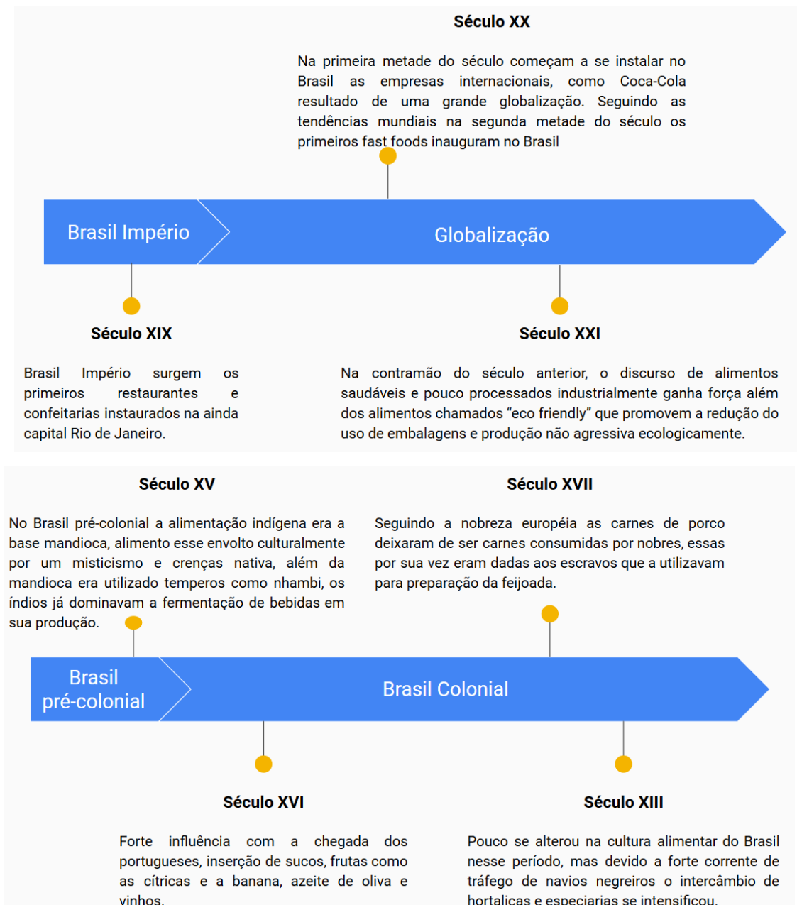
Figura 2 - Linha do tempo do discurso Engenharia de Alimentos no Brasil

discurso da Engenharia de Alimentos em um infográfico da linha do tempo foi realizado para este trabalho com o desafio de relacionar teoria e prática ativa do que objetivamos refletir.