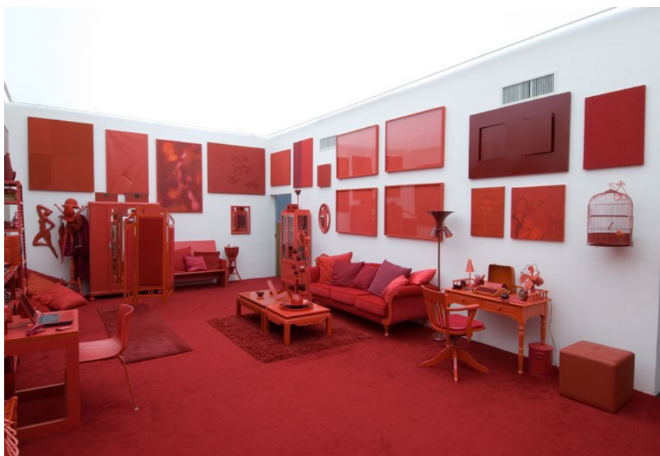
Fig. 5 - Cildo Meireles, Desvio para o vermelho I: Impregnação, 1967-1984.

Considerando a experiência da vida como propulsora de atos poéticos, o corpo mole-estruturado próprio da ação serve como orientação para a disfunção do cotidiano, sendo meio de estabelecer uma relação viva com a cidade, torcendo os limites do corpo e do espaço e ampliando a noção da corporeidade. Interrompendo os fluxos contemporâneos; obrigando a fazer uma pausa e uma quebra no comportamento no espaço coletivo. De acordo com Bachelard (2003, p. 154),