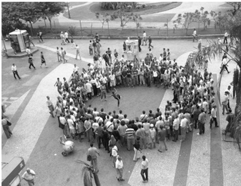
Fig. 1 - Lygia Pape, Espaços imantados, Rio de Janeiro 1995/2011

A arte contemporânea está repleta de exemplos de artistas que investigam e experimentam outros modos de produção do espaço urbano que não os habituais. Uma das artistas brasileiras com larga trajetória nesse sentido foi Lygia Pape, a qual, ao longo de anos de trabalho, gerou conceitos oriundos de sua observação e prática criativa no meio urbano. Um dos principais conceitos gerados por Pape é o de “espaço imantado”, utilizando esse termo para se referir a situações existentes no cotidiano de grandes cidades que prendem a atenção e atraem os sentidos dos passantes como um ímã. Ou seja, algo na cidade que cria uma aura que eleva um elemento ou lugar a um patamar sensorial distinto, destacando-o de outras situações que acontecem no mesmo espaço (BORJAS-VILLEL; VELÁSQUEZ, 2012). Um espaço imantado dentro da cidade, por exemplo, seria gerado pelos vendedores ambulantes ao reunir diversos grupos de pessoas ao seu redor quando suas bancas estão postas. São espaços que imantam o olhar e o corpo.