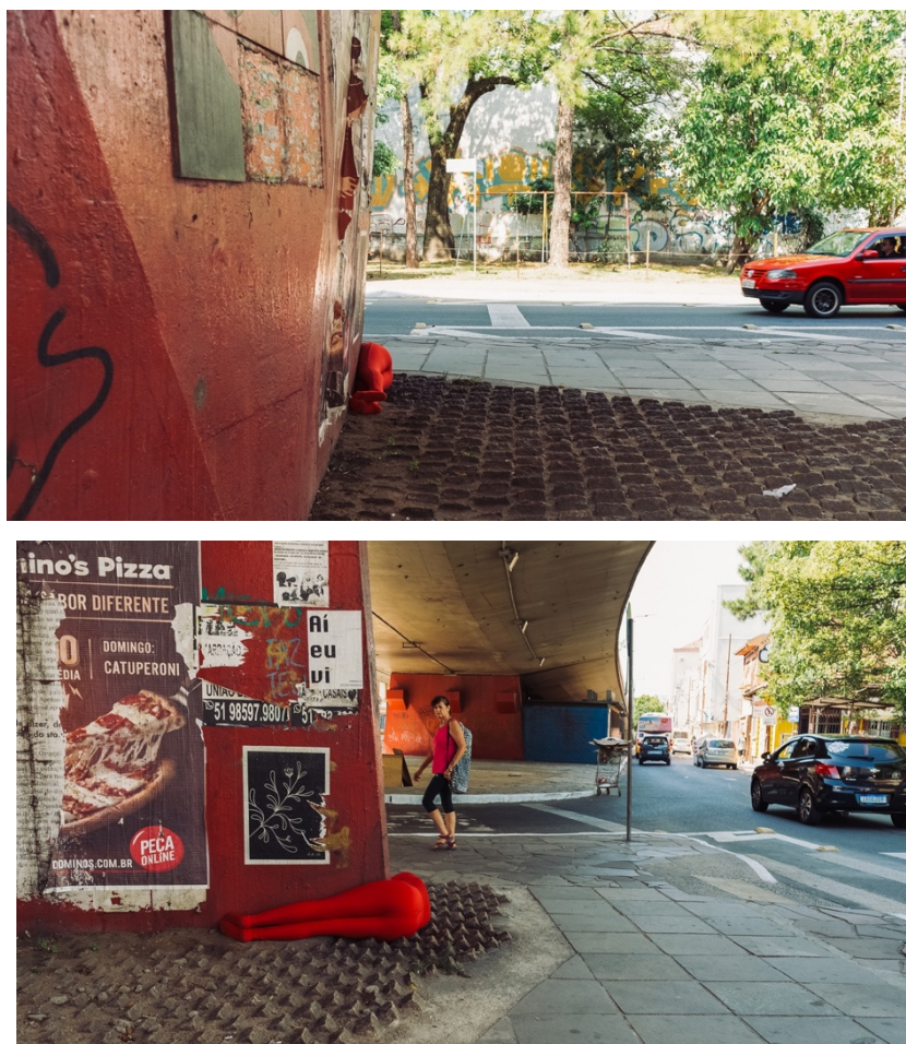
Fig. 3 e 4 - Ação Meus desvios para o vermelho, 2020, por Marina Rombaldi. Fotografia: Desirée Ferreira. Edição: Rodrigo Onzi. Acervo da artista.

A referência que nomeia a ação é encontrada no trabalho do artista brasileiro contemporâneo Cildo Meireles, na obra Desvio para o vermelho (1967-1984). Apesar de essa obra se referir a um outro momento na história do país, a singular visão do artista de entrever as coisas do mundo pelos contextos políticos, sociais e culturais em seu trabalho ressoa, agora, atrelada a um outro contexto. A obra de Meireles é formada por três ambientes. No primeiro, o interior de uma casa com móveis e uma coleção inteira de objetos recolhidos, doados, emprestados, comprados e bem organizados (Fig. 5); tudo em tons variantes de vermelho. No segundo, um corredor escuro com um frasco caído do qual escorre um líquido vermelho que cria um trajeto que move o observador até o terceiro ambiente, onde existe uma pia branca desnivelada da qual escorre um líquido também vermelho.