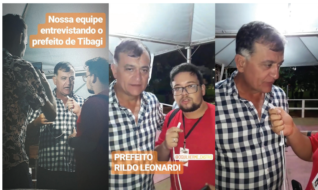
Imagem 06: Entrevista com o prefeito de Tibagi, Rildo Leonardi, sobre o carnaval da cidade