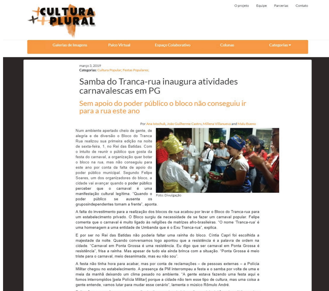
Imagem 01: Captura de Tela do site na matéria produzida no primeiro dia da cobertura especial do carnaval 2019