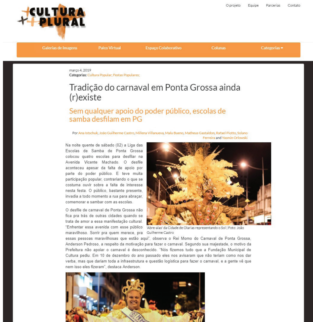
Imagem 03: Captura de Tela do site na matéria produzida no segundo dia da cobertura especial do carnaval 2019