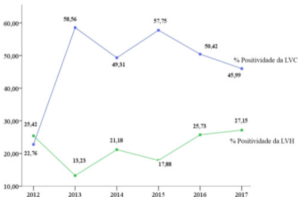
Figura 1: Percentual de Positividade da LVH e LVC ao longo dos anos estudados, 2012-2017