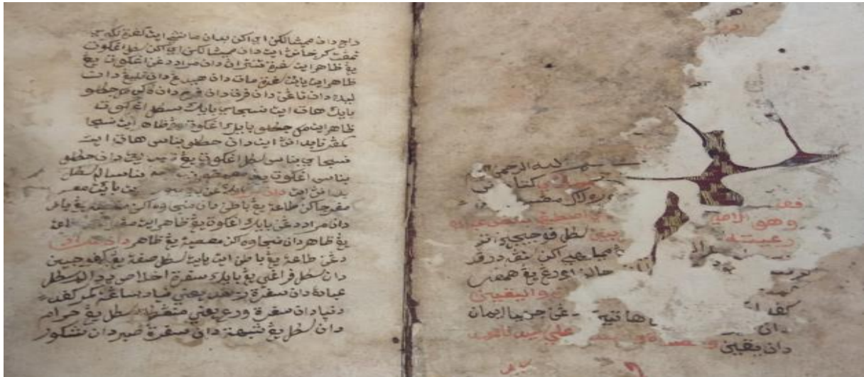
Halaman pertama MSS 4362

Berdasarkan Rajah 3, manuskrip MSS 4362 dianggap tidak lengkap kerana jelas menunjukkan warna dakwat tulisan sudah pudar dan hilang. Manuskrip turut berlubang dan rosak dimakan serangga. Walaupun manuskrip ini bermula dari bab pertama sehingga bab akhir akan tetapi terdapat beberapa helaian manuskrip yang tercicir dan hilang. Oleh kerana beberapa ciri dan faktor tersebut menyebabkan manuskrip ini dianggap tidak lengkap.