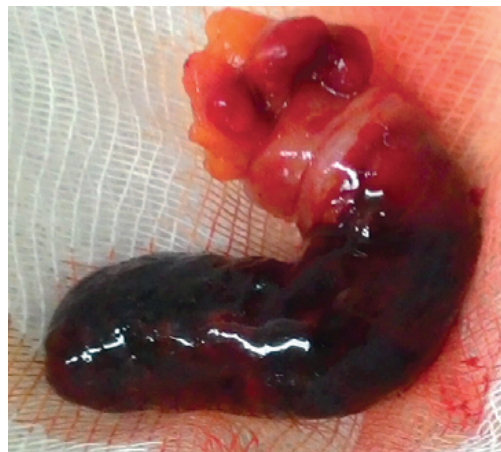
Рис. 2. Макропрепарат больной Л. Червеобразный отросток полностью вывернут слизистой оболочкой наружу, в основании стенка купола слепой кишки, слизистая оболочка черного цвета, стенка отростка отечная, в брыжейке множественные сливные кровоизлияния Fig. 2. Macro-specimen of patient L. The appendix is completely turned outward, at the base of the wall of the dome of the cecum, the mucous membrane is black, the wall of the appendix is edematous, in the mesentery there are multiple draining hemorrhages