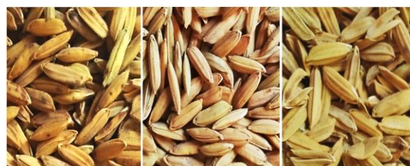
(a) (b) (c)

Intensitas serangan hama diperoleh dengan cara menentukan persentase dari tiap jumlah gabah per kriteria penilaian. Kriteria penilaian yang digunakan adalah gabah terserang walang sangit, gabah bernas dan gabah hampa (Gambar 1).